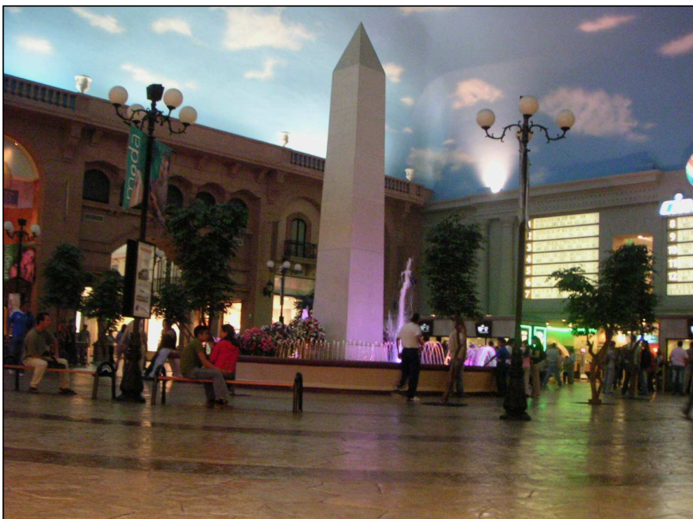
Fotografía 3 : La plaza del obelisco, donde se ubican el Cine con varios bares y restaurantes, bajo alumbrado diurno (Sabatier, 2005)