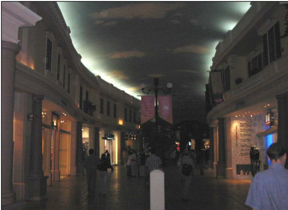
Fotografía 2: Una de las principales calles, bajo alumbrado nocturno (Sabatier, 2005)

En segundo lugar, el arreglo de los pasillos principales busca recrear unas calle s (así llamadas) (fotografía 2). Su diseño curvo les da un carácter cuanto más antiguo que los núcleos urbanos de la metrópoli aplicaron el plano en cuadrícula y, partiendo de dos domos, convergen hacia una plaza que enarbola en su centro un obelisco miniatura montado sobre una fuente. Al enlosado envejecido y a las farolas de estilo siglo XIX contestan las fachadas neoclásicas con columnas, un falso piso adornado de jardineras y cortinas en las ventanas, para formar un decorado que la plaza del obelisco (así llamada) escenifica aún más con balcones, puertas y ventanas enmarcadas, coronadas por ánforas (fotografía 3).