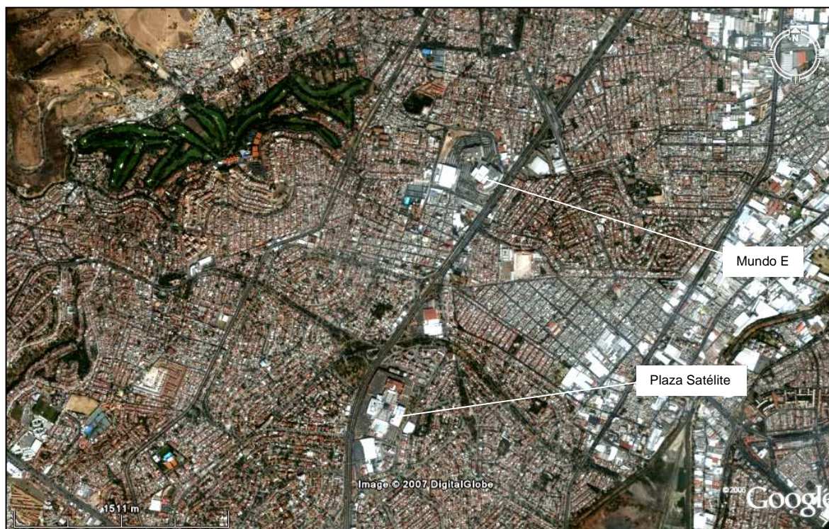
Fotografía 1(vista aérea): Ubicación de Mundo E y Plaza Satélite en la zona noroeste de la metrópoli

Pero es obvio que están en competencia, y Mundo E, recién llegado, se ubicó a seis kilómetros de Perinorte, más al centro de gravedad del conjunto de colonias de clase media, pero de hecho a menos de dos kilómetros de Plaza Satélite, como lo muestra la fotografía 1 aquí debajo. Dado que el éxito de Plaza Satélite se mantiene desde hace treinta años, esta cercanía, fuente de competencia fuerte, reforzó ciertamente el contexto de exigencia explicado anteriormente para los constructores de Mundo E, y por consecuencia la necesidad de una nueva fórmula de CCR, cuanto más se trata de FRISA, un grupo inmobiliario importante que opera desde varias decenas en México pero que no había construido ningún centro comercial en la capital.