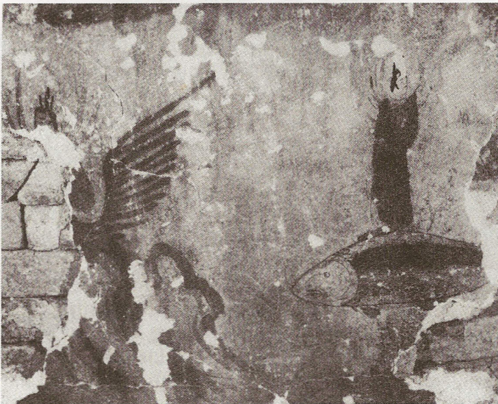
Fig. 5 Shanxisheng kaogu yanjiusuo et al. 1994, p. 36.