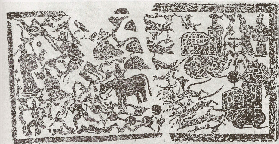
Fig. 2 Jiangsusheng wenwu guanli weiyuanhui 1959, fig. n° 52.