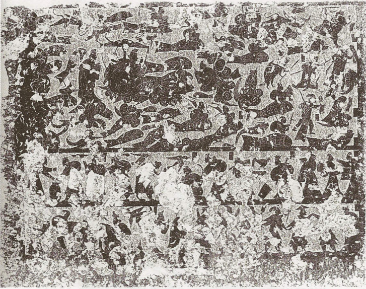
Fig. 4 Chavannes 1909, n° 130.