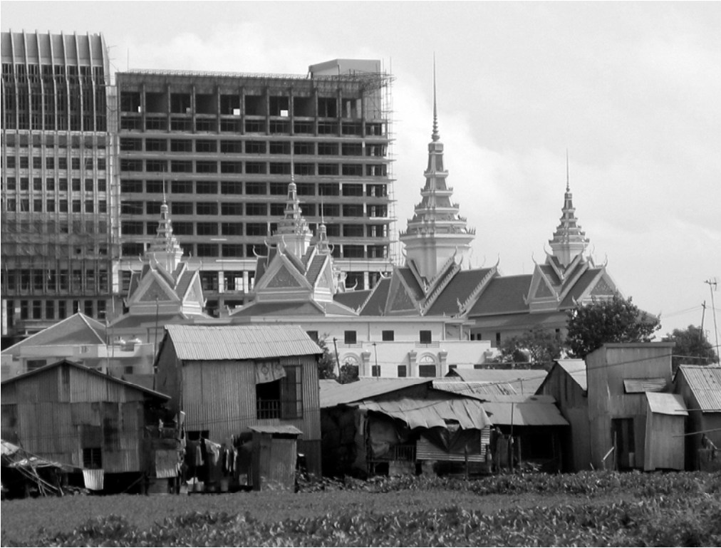
Photo 4 : Certains quartiers informels sont situés au centre ville sur des quartiers à très haute valeur foncière, comme ici celui du Bassac, qui jouxte le tout nouveau bâtiment du ministère des Affaires étrangères (de style néo-traditionnel) et l'immeuble du Casino de Phnom Penh (immeuble en construction) Cliché V.Clerc 2003

situés dans les quartiers centraux. Même les habitants des quelques quartiers informels réhabilités du centre ville à qui l'administration cadastrale avait demandé de déposer un dossier de demande d'immatriculation systématique de leur terrain se voient aujourd'hui, eux aussi, menacés d'expulsion.