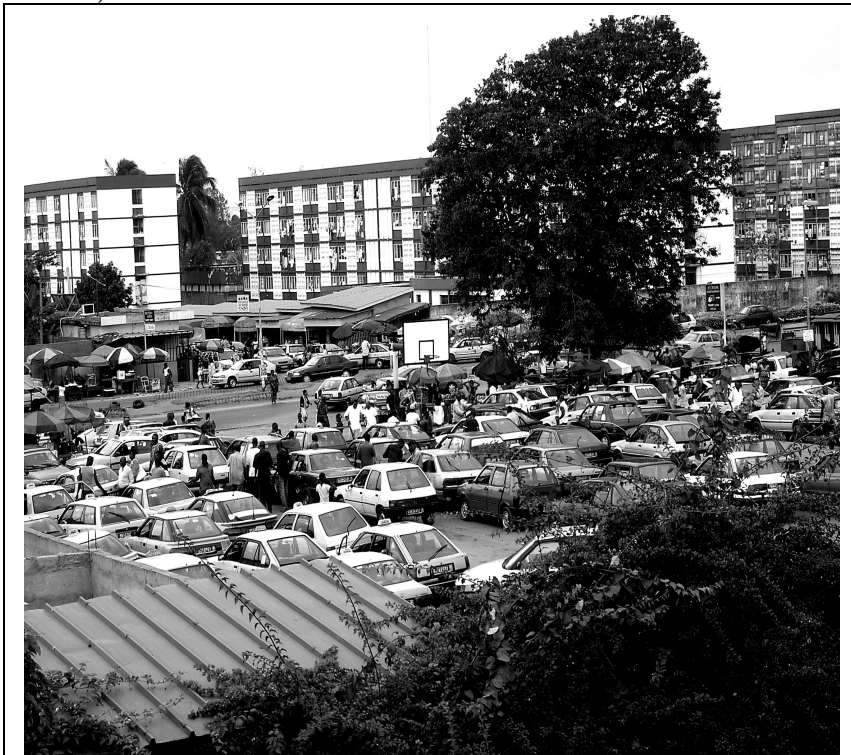
Photo 1 : Jardin public du château d'eau de Cocody transformé en gare de taxis communaux. Au fond la résidence universitaire de la cité rouge. (Cliché de l'auteur, Août ,2008)