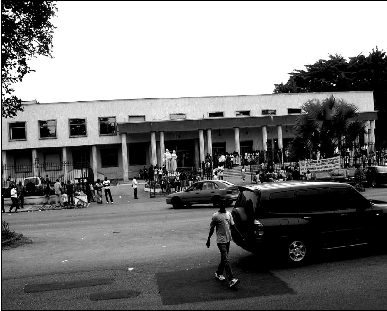
Photo 3 : L'hôtel communal de Cocody bâti à l'emplacement du jardin public du lycée classique. (Cliché de l'auteur, Août 2008).

Plusieurs raisons sont évoquées çà et là pour justifier l'urbanisation et le recul de la nature dans développement de ce centre urbain. Pour les riverains à ces espaces, c'est la croissance du banditisme dans la ville d'Abidjan à partir de 1980, transformant les jardins publics en de véritables repères de bandits qui est la cause de leur affectation à d'autres fins par les pouvoirs publics. Outre la délinquance, les jardins et places publiques ne sont pas entretenus. En effet, il n'est pas rare d'y rencontrer des bouts de papier ou même des ordures ménagères. Ces espaces sont même devenus des dépotoirs et des WC publics. Certains de ces espaces sont même devenus lieux culturels ou des manifestations sont organisés.