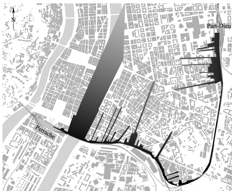
Figure 1 : Profondeurs de champ visuel à 90° par rapport à la ligne de train reliant les gares de Lyon Part-Dieu et Lyon Perrache.