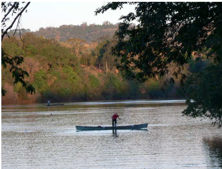
Photo 1 : Des pêcheurs sur le fleuve Uruguay, à quelques kilomètres du futur barrage de Foz de Chapecó – août 2006

La frontière entre l'état du Santa Catarina et du Rio Grande do Sul est marquée depuis la fin du 19 e siècle par la colonisation allemande. De nombreuses familles allemandes sont arrivées dans le sud du Brésil et se sont installées dans cet espace, défrichant cette zone de moyenne montagne, y installant une agriculture familiale et aidant à la construction d'une voie de chemin de fer joignant, le sud à São Paulo. Ce ne sont pas moins de vingt-cinq mille colons allemands qui arrivèrent au Brésil lors des cinquante premières années de ce mouvement migratoire. Aujourd'hui encore, on retrouve une trace importante de cette origine sur les populations locales, notamment sur la marge rio grandense du fleuve Uruguay.