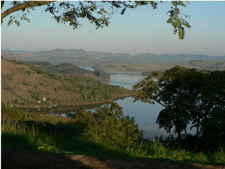
Photo 2 : Les paysages d'Itá remodelé après la construction du barrage. – août 2006 – G. Leturcq

À travers cet exemple, nous avons pu constater la reconstruction du territoire par les nouvelles populations. Les espaces et paysages seront ainsi remodelés dans divers lieux et en divers points, dans le cadre unique de la réinstallation de familles à cause de la construction de barrages. On trouve une marque importante sur le paysage une fois le barrage et son réservoir terminés (cf : Photo 2) et lors de l'installation de familles sur des terres non utilisées. Il y a aussi une transformation du territoire pour les populations réceptives et pour les populations qui perdent des voisins sans être directement touchées par le barrage ou son réservoir. Nombreuses sont les catégories d'« atingidos », mais on peut faire la distinction des directs ou indirects, sur lesquels le barrage aura plus ou moins d'influence sur leur vie.