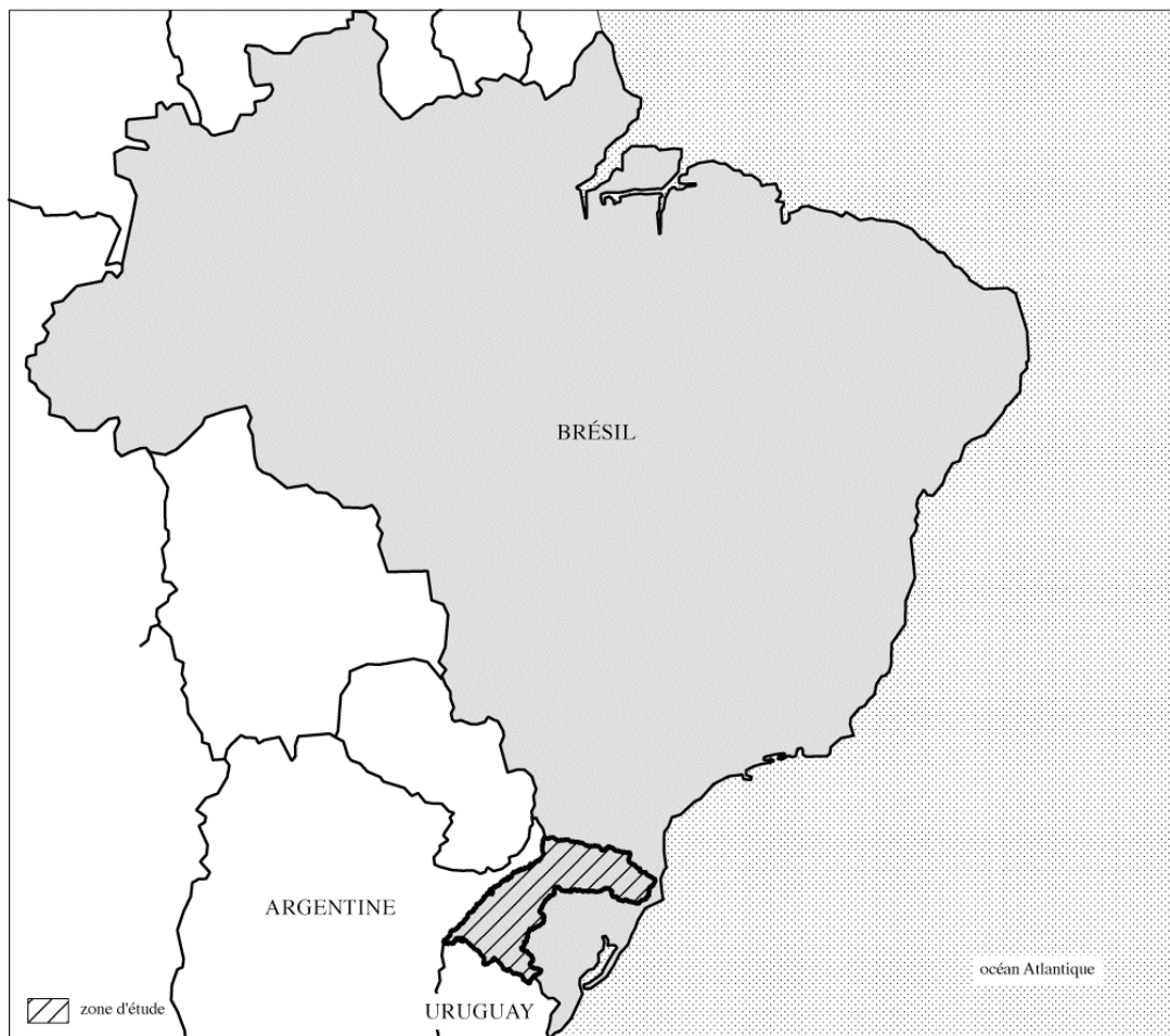
Carte 1: Localisation de la zone d'étude, le bassin versant du fleuve Uruguay, au Brésil.

À travers l'analyse historique de cette contestation sociale, on peut discerner son empreinte territoriale sur tout l'espace brésilien, avec deux zones de concentration, que sont l'Amazonie et le Sud. C'est sur ce dernier espace polémique que nous allons maintenant nous attarder. Le sud est actuellement une région dynamique pour le secteur électrique et très polémique pour les « atingidos ». La localisation des barrages et le potentiel d'expansion se situent sur le bassin versant du fleuve Uruguay ( cf : carte 1). Le plan 2010 prévoyait la construction de 23 barrages à l'horizon 2010, mais la crise économique et divers facteurs externes ont limité leurs implantations. Seulement huit sont en fonctionnement ( cf : Carte 2) ou en voie de l'être sur la totalité des barrages prévus. Mais le plan 2030, prévoit de continuer à exploiter ce bassin et même si le nombre de barrages prévus n'est pas encore déterminé, nombreux sont en projet ou en cours de réalisation.