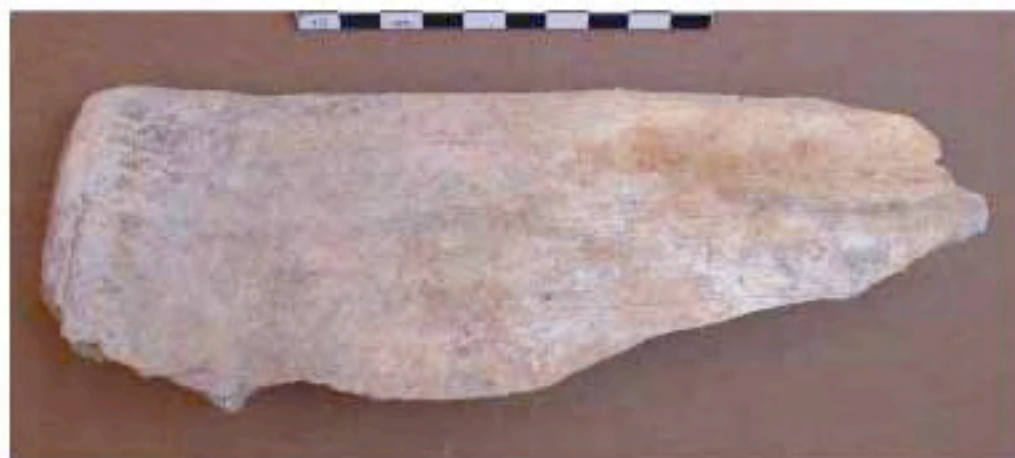
Scapula de camélidé utilisée comme pelle. La face inférieure de l'outil est lustrée