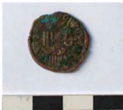
Monnaie HQ07 HS-2