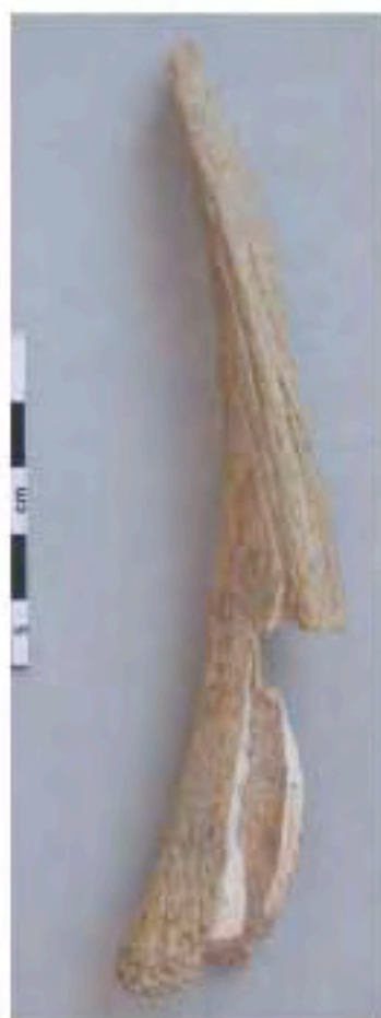
Cheville osseuse vrillée (corne) d'un bouc