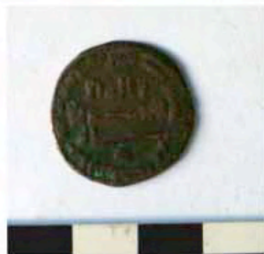
Monnaie HQ07 HS-3