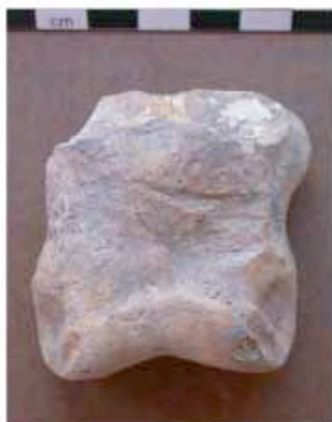
Coup de couperet sur une deuxième phalange de cheval