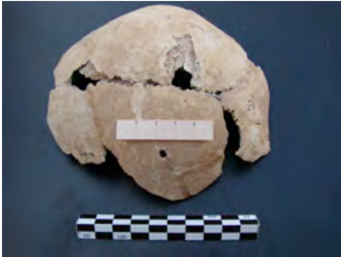
Figure 1. Face extérieure de l'os occipital. Présence du trou qui passe à travers.

Au niveau des dents, nous trouvons une seule petite carie dentaire ce qui indique peut être un régime alimentaire pauvre en hydrates de carbone à cette période ?