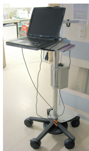
Figura 2 - Carrinho dos médicos com computador portátil em 2008.