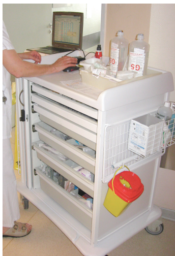
Figura 3 - Carrinho dos medicamentos com computador portátil em 2008.

Quando da observação em 2003, o instrumento era utilizado de forma intensa e sistemática, confirmando assim a sua reputação de unidade de tratamento aberta às novas tecnologias. Os médicos realizavam suas prescrições e as alteravam em função da evolução do paciente. As enfermeiras consultavam e imprimiam os tratamentos médicos e os PAM, em seguida validavam estes após ter administrado os medicamentos. O chefe de unidade interessou-se pela prescrição informatizada por muito tempo e contribuiu para o seu desenvolvimento. A unidade já tinha sido o lugar de teste, em 1996, de um software de prescrição medicamentosa. Assim, o novo software, mais eficiente, foi adotado mais facilmente uma vez que o pessoal já tinha experiência, mas, também porque havia permitido restabelecer a “paz social” entre os médicos e enfermeiras ao suprimir antigos conflitos ligados à prescrição oral. Os médicos diziam que podiam acompanhar facilmente os tratamentos prescritos e ser auxiliados pelo computador. Além disso, a divulgação da ferramenta no hospital foi acompanhada de uma série de ações como campanhas de sensibilização dos médicos e dos enfermeiros para que participassem do controle da conformidade das prescrições realizadas pelos médicos.