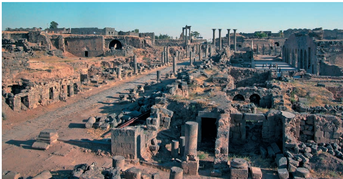
La rue nord-sud entre le nymphée et la mosquée d'Omar : vue vers le sud depuis la mosquée d'Omar. À l'ouest, les thermes du Centre.

La colonnade ouest est marquée à deux reprises par une avancée du trottoir sur la chaussée. Chacune d'entre elles correspond à un groupe de quatre colonnes d'un diamètre légèrement supérieur, surélevées par un piédestal et portant une console, très saillante, de dimensions supérieures à celles de