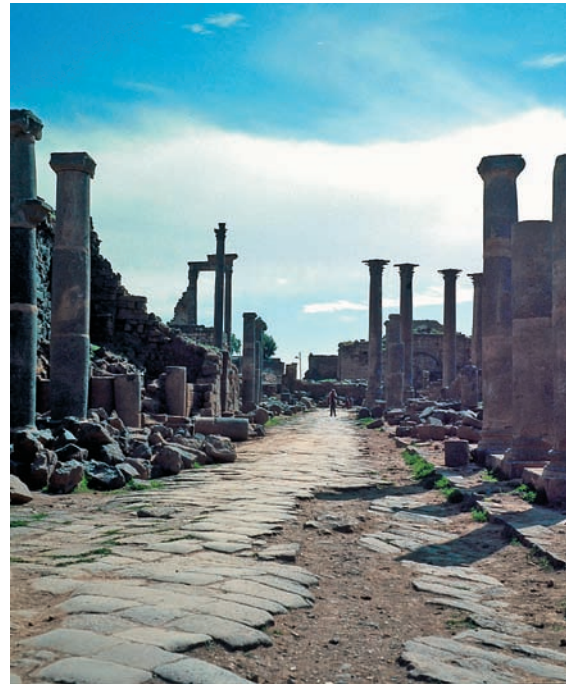
La rue nord-sud entre le nymphée et la mosquée d'Omar : vue vers le sud.

La chaussée a gardé son pavement de basalte à joints obliques qui a été utilisé jusqu'à l'époque médiévale. La chaussée est limitée par des trottoirs, encore visibles sur la majeure partie du trajet et d'une hauteur équivalente à une petite marche. Le