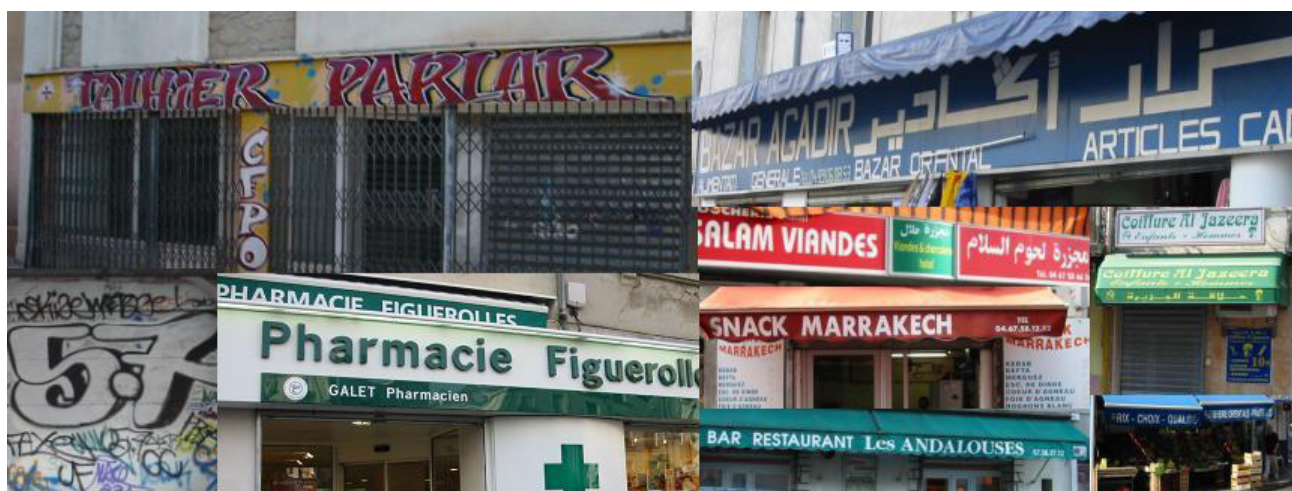
Figure 4 - Photos prises par les auteurs