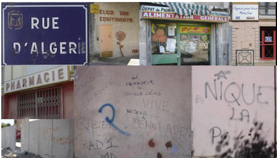
Figure 2