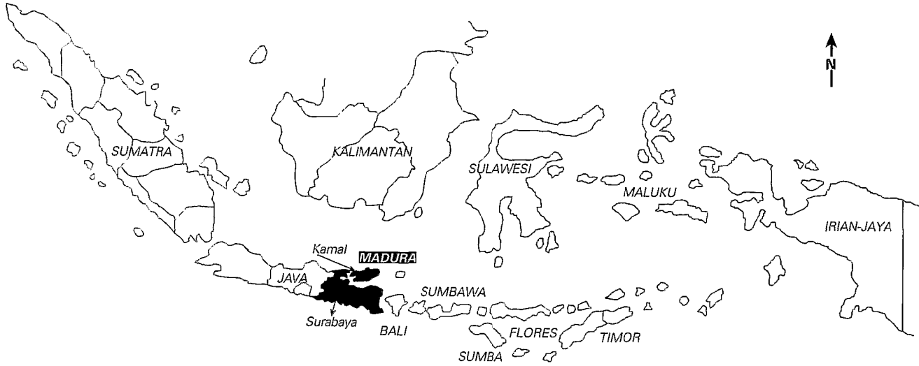
FIG. 1. — Java-Est dans l'Indonésie.

■ Province de Java-Est, comprenant l'extrémité orientale de Java et l'île de Madura