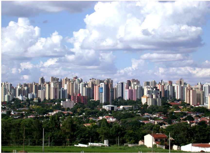
Figure 6 Londrina en 2005