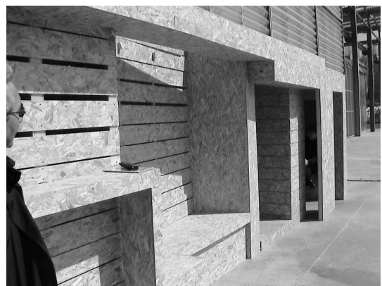
Assises dans les empreintes côté « rue » traitement acoustique et luminosité