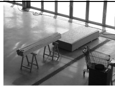
matériel de départ