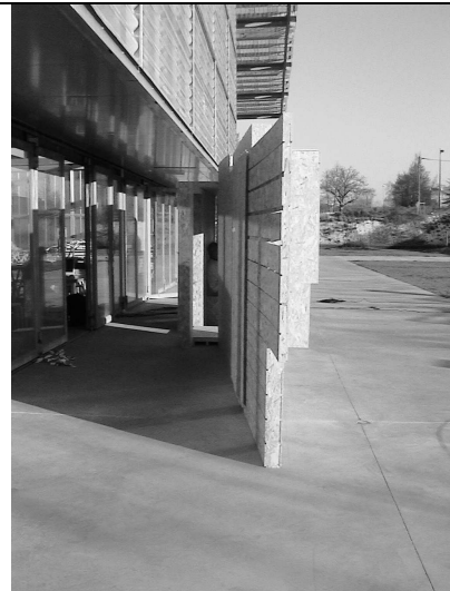
De 2 cm à 1 mètre 60 : la structure partage le trottoir / quai