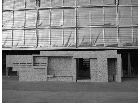
Articulation, Limite, Inclusion : 3 enjeux

Pour citer ce document : CHELKOFF, Grégoire. Ecologie sensible des formes architecturales. In :EURAU'2004 European Research in Architecture and Urbanisme, Journées européennes de la recherche architecturale et urbaine "La question doctorales", 12- 14 Mai 2004, Marseille, France. Marseille : EURAU European Research in Architecture and Urbanisme, 2004, 9p.