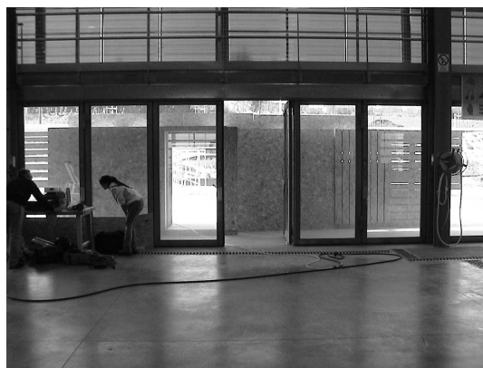
Vue du dedans, la trame existante scande le dispositif, face « lisse » de la coulisse côté bâtiment