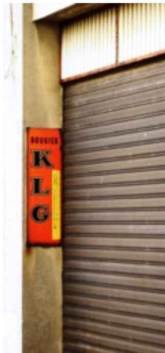
Fig. 3 Thermomètre publicitaire KLG

Les artisans choisissent des supports publicitaires pour leur effet de proximité. Ils se déterminent aussi en fonction du coût, qui doit demeurer faible. Sur ce point, une de leur particularité est de savoir tirer profit de la publicité des autres. Les garagistes, en particulier, se signalent dans l'espace urbain en utilisant sur leur façade le matériel publicitaire de leurs fournisseurs et de la marque dont ils sont concessionnaires. Les marques d'huile sont les plus présentes avec des plaques métalliques, des publicités peintes puis des enseignes lumineuses. Ces marques apparaissent aussi sur du matériel plus utilitaire. Michelin, mais aussi d'autres fabricants de pneumatiques, fournit à ses clients mécaniciens des plaques avec les tailles et les références des produits de sa gamme. Le fabricant de bougies KLG, par exemple, distribue aux garagistes de grands thermomètres d'extérieur aux couleurs de la marque et ornés des trois lettres de son sigle.