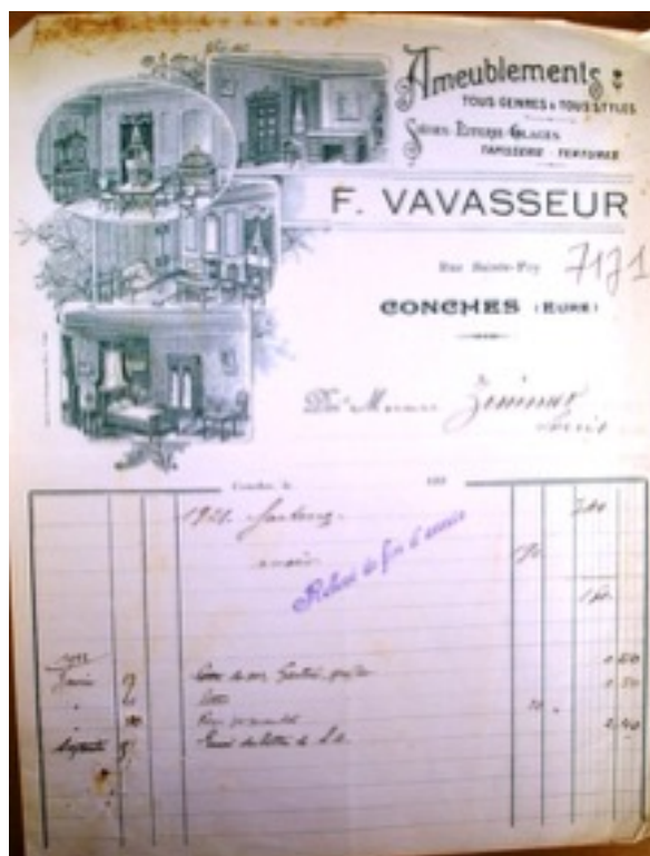
Fig. 2 Facture d'un artisan ébéniste, Conches (Eure), 1921.

Le papier commercial à en-tête existe dès le milieu du XIXe siècle mais son usage paraît encore limité aux plus grosses « places ». Il se généralise à partir des années 1890 12 . Alors que les enseignes sont exposées aux yeux de tous, les en-têtes touchent un public plus restreint, qui a déjà fait une démarche auprès de l'artisan. Ces documents sont destinés aux correspondants des artisans ; c'est-à-dire à la clientèle habituelle. Mais, la fréquence de l'emploi de papiers richement illustrés jusqu'au milieu du XXe siècle atteste de l'attention particulière que les artisans y portent. Il serait sans doute exagéré d'y voir de véritables œuvres d'art ; toutefois, l'influence du courant des arts décoratifs y est indéniable. Ainsi, certaines des factures des années 1900 présentent nettement la marque du style Art nouveau. De même, la profusion des informations qu'offrent ces documents indiquent que les artisans s'en servent comme outil de communication. Car, l'un des intérêts de ces en-têtes, par rapport à l'enseigne, paraît bien être la quantité d'informations, écrites ou dessinées, qu'elles peuvent porter. Entre les années 1890 et 1930, la taille de l'en-tête se développe. Celui-ci est de plus en plus long. Il en arrive à occuper toute la partie supérieure du document. L'information devient surabondante, foisonnante. Elle perd en clarté et en lisibilité. C'est certainement l'une des raisons qui expliquent le retour à des documents plus sobres après la seconde guerre