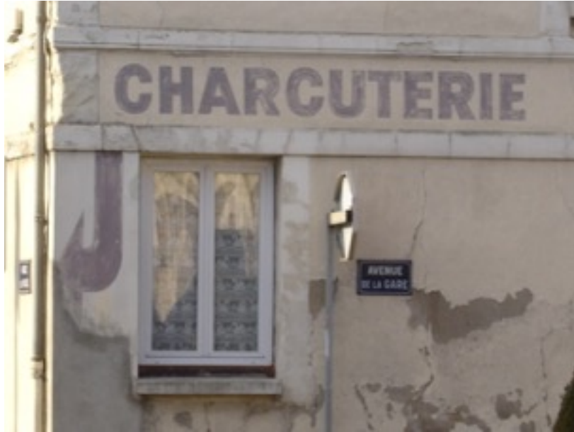
Fig. 1 Un exemple de pré-enseigne, Route nationale 10, Pezou (Loir-et-Cher)