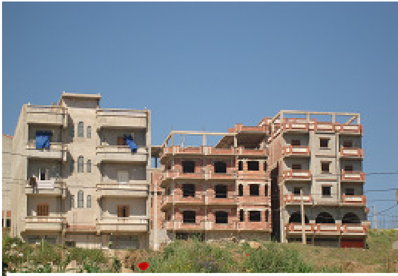
Photo n°2 : Lotissement l'Eucalyptus. Source : auteurs, enquête terrain, 2008.

appartement. Par conséquent ce nombre peut dépasser la limite réglementaire pour atteindre 4 et même 5 niveaux.