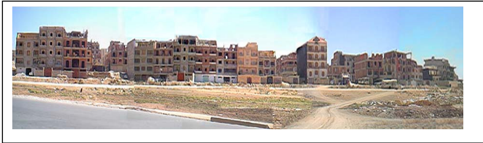
photo n° 01 : Facade urbaine du lotissement « Frères Ferrad ».

constructions avec des matériaux très simples, d'autres avec des matériaux plus luxueux reflétant les capacités financières de chacun.