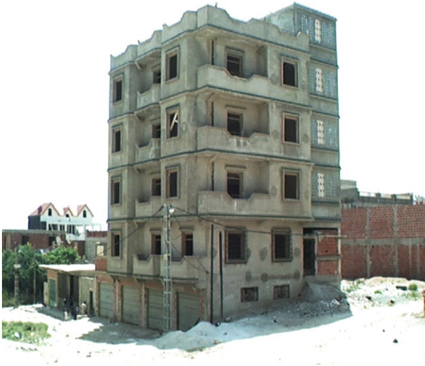
Photo n°04 : Multiplication des niveaux d'habitation et des locaux commerciaux au R.D.C, Enquête terrain, 2004

niveau du RDC (ou du sous-sol) vient répondre à des besoins socio-économiques qui dépassent souvent le simple souci d'améliorer le revenu familial. Plus qu'un revenu d'appoint, le local commercial devient un véritable investissement économique.