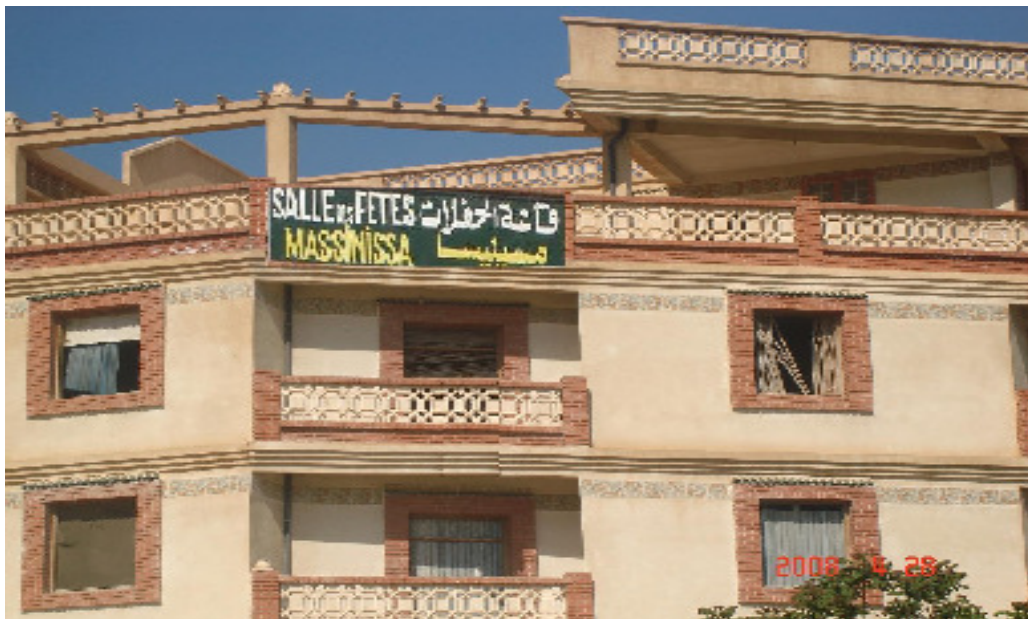
Photo n°05 : Détournement de la fonction résidentielle, une salle des fêtes, lotissement boussof )