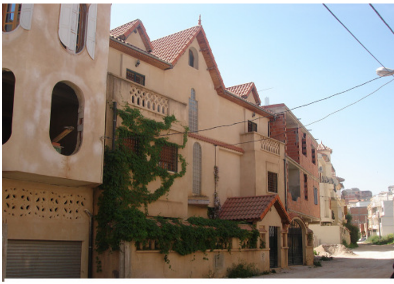
Photo n°03 : exemple d'une villa simple.

L'analyse de ces pratiques nous a montré qu'au sein d'un même lotissement il existe une variété de constructions, allant du simple R.D.C surmonté d'un étage jusqu'aux constructions de plus de 4 niveaux. L'exemple le plus représentatif reste celui du lotissement El Riadh, où le cas des maisons à quatre niveaux (R.D.C + 3 étages) est très important et atteint 19% de l'ensemble des lots construits. Ces cas reflètent le détournement de la loi et les spéculations