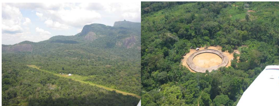
Photos 1 et 2 : piste d'atterrissage de Demini dans son contexte forestier, le village (photo 2) se trouve en contrebas de la pierre noire apparaissant à l'extrémité gauche.

On notera que le projet d'éducation de la CCPY (PEY), bien qu'il ne soit pas en lui-même placé sous la bannière du développement durable, aura néanmoins des effets dans ce champ. Ses objectifs sont en effet proches de ceux du DD, et plusieurs activités seront développées en conjonction avec les activités agroforestières. Pour ces raisons, nous incluons souvent le PEY dans notre analyse des « initiatives de développement durable » à Demini.