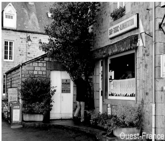
Figure 3 : L'unique commerce de Rimou ferme dimanche

Dimanche midi, le bar-tabac-alimentation de Rimou fermera définitivement.