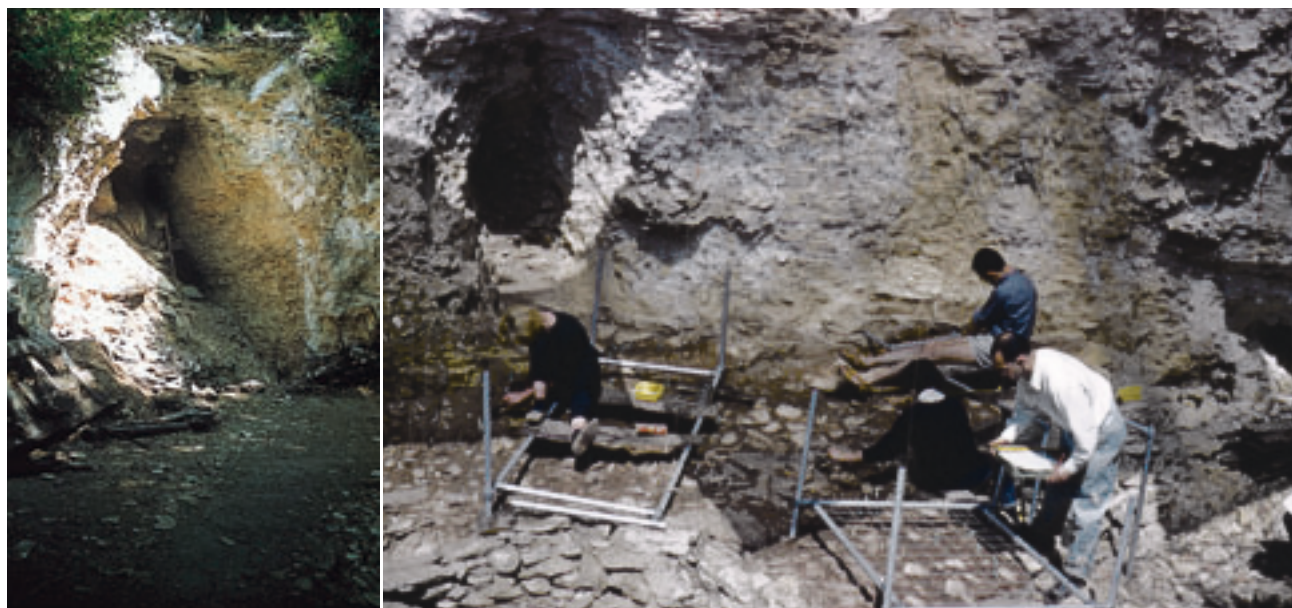
LA GROTTÉ DU RENNE, DONT ON VOIT ICI L'ENTRÉE (à gauche), fait partie d'un ensemble de cavités disposées sur quelques kilomètres le long de la Cure, affluent de l'Yonne. Explorées depuis la fin du XIX e siècle, ces cavités ont été fouillées principalement de 1946 à 1968. L'importance particulière de la grotte du Renne réside dans le fait que c'est le seul site où des outils en os, des objets de parure et, aujourd'hui, des meules sont associés à l'homme de Neandertal.