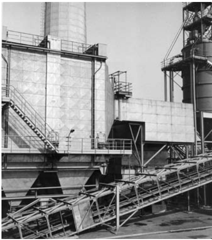
Usine d'incinération de résidus urbains d'Ivry-sur-Seine, chaîne d'extraction du mâchefer (à droite, on aperçoit le silo à cendres volantes) 1972