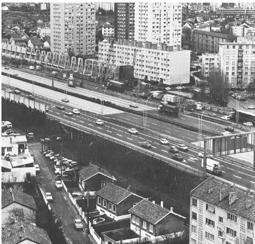
Construction d'un écran de 9 m. de hauteur à l'Hay-les-Roses

Valéry Giscard d'Estaing avec qui il a fondé les Républicains indépendants, d'Ornano obtient lors du remaniement de 1977 un ministère rassemblant l'Environnement et la Culture, qui évolue en avril 1978 vers un grand ministère de l'Environnement et du Cadre de vie, regroupant des compétences et des services issus de l'Équipement, de l'Environnement et de la Culture.