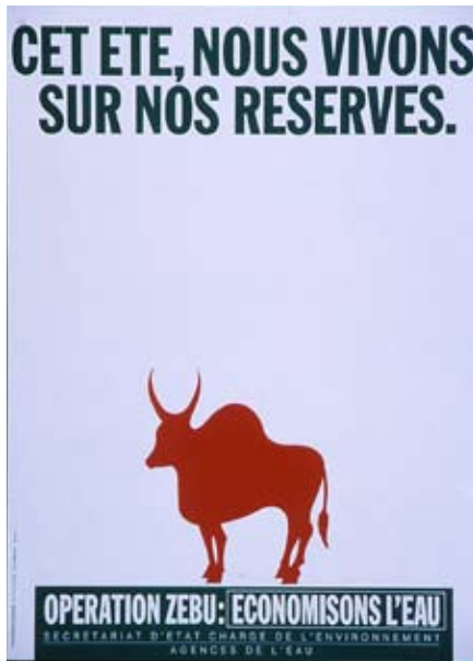
Exposition d'affiches en 1990