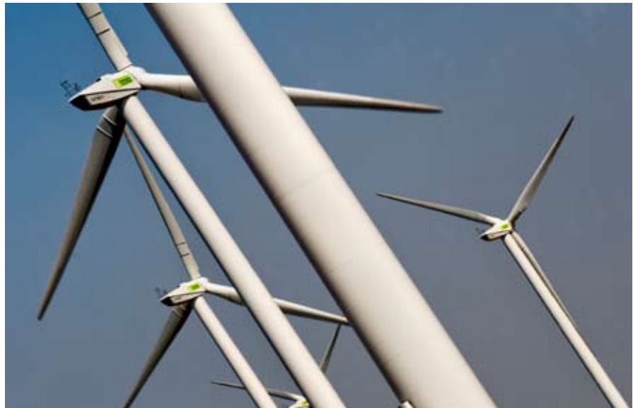
Ferme éolienne dans la Beauce

Les changements introduits par la nouvelle majorité en 2007 comprennent trois volets en ce qui concerne l'environnement. En premier lieu, dans le prolongement de l'idée défendue en 1978 (ministère D'Ornano) et partiellement en 1986 (ministère Carignon délégué auprès du ministère de l'Équipement), il