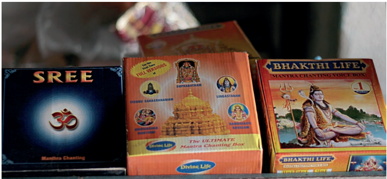
Boîtes électroniques à mantra vendues chez un détaillant de Madras, 2008.

En effet, l'innovation de l'automate par rapport aux supports enregistrés n'est pas une question de progrès technologique. Elle se situe plutôt dans le fait de pouvoir produire du son en direct sans la moindre intervention de musiciens, un procédé bien différent de l'enregistrement. Un enregistrement diffuse une prestation musicale en différé tout en rendant la présence physique des musiciens non visible par l'auditeur. Cependant, il ne remet pas fondamentalement en cause le fait que le son a été précédemment produit par des agents humains, c'est-à-dire des musiciens en chair et en os. Fait remarquable, G. K. explique que la qualité sonore requise pour les cloches, en terme de vibration, peut être produite uniquement en temps réel. Il est certain qu'un bon ingénieur du son pourrait réaliser sans grande difficulté un tel enregistrement, très proche des sonorités de l'automate émises en direct. Il semble que le propos de G. K. se situe à un autre niveau, même s'il rencontre quelque difficulté à expliciter le caractère innovant de sa création en termes non exclusivement techniques. Ce