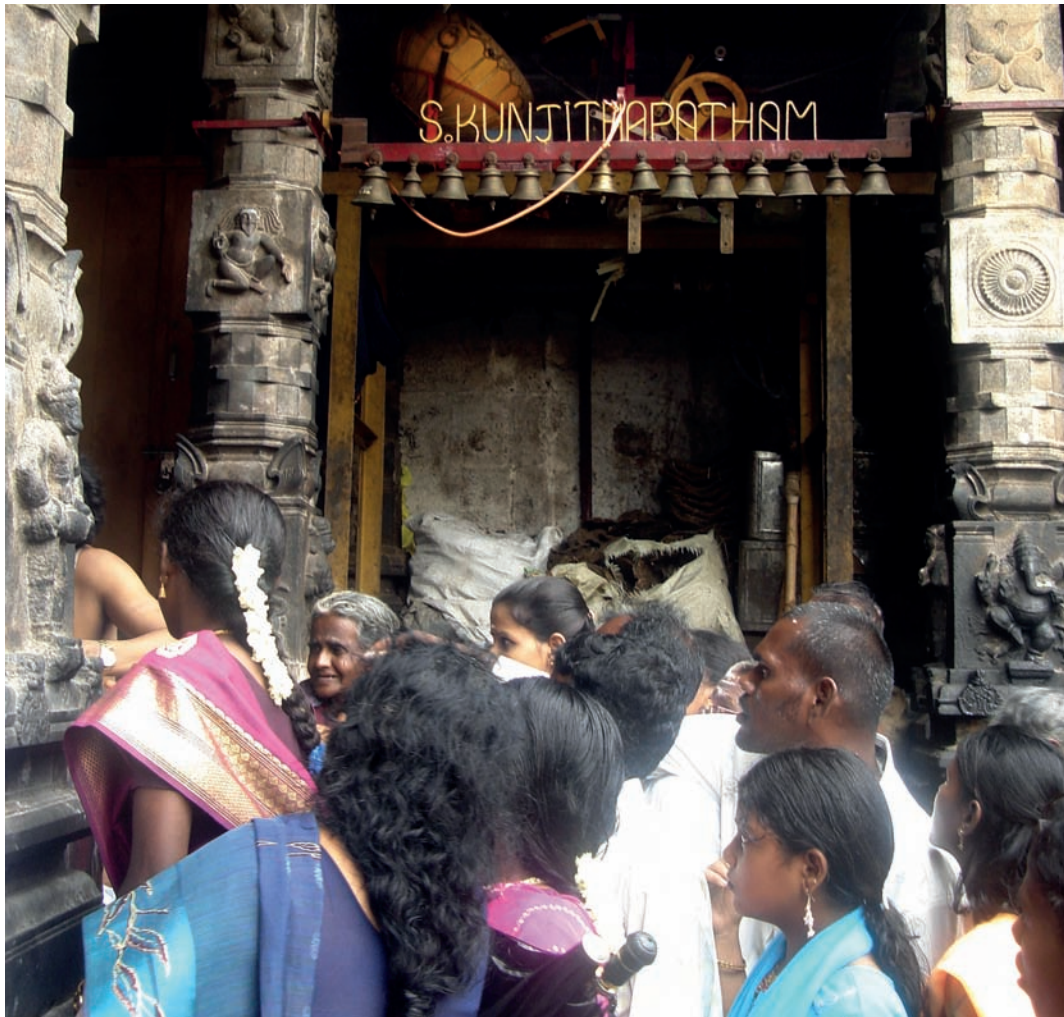
Dévôts recueillant les prasadam (offrandes consacrées) devant l'installation sonore, grand temple de Chidambaram, 2008.

automatisés (Grimaud 2008 ; Vidal 2007). On remarquera d'ailleurs sur ce point que les installations permanentes de cloches, celles qui sont actionnées manuellement dans les grands temples du Tamil Nadu, fonctionnent dans une logique tout à fait similaire à l'automate. Au temple de Chidambaram ( Siva-Nataraja ), par exemple, la prolifération des clochettes disposées en séries autour des sanctuaires ainsi que l'usage simultané de trois immenses cloches créent au