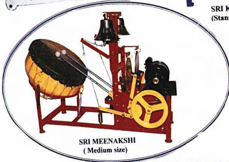
SRI MEENAKSHI (Medium size)