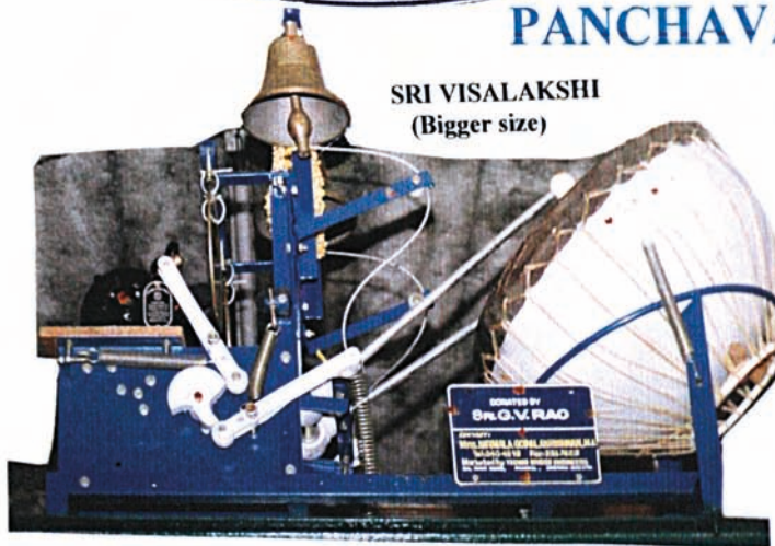
SRI VISALAKSHI (Bigger size)