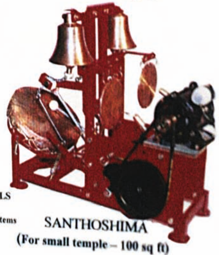
SANTHOSHIMA (For small temple – 100 sq ft)

Designers of special equipments ELECTROMECHANISATION OF BIG TEMPLE BELLS SANDAL PASTE MACHINE, other temple requirements. CONSULTANTS: Metal Treatment, Metal Finishing, Material handling, Storage and assembly systems Exports and imports, representation for foreign and Indian companies.