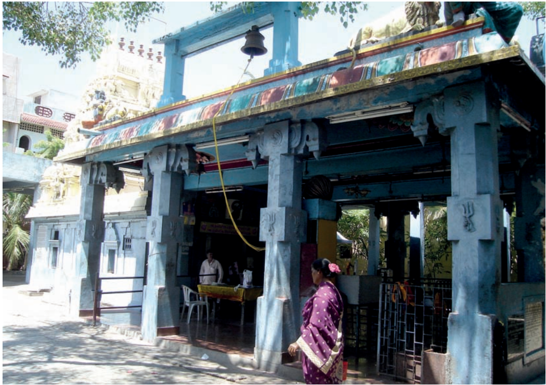
Dispositif sonore dans un temple de quartier, Madras, 2008.

pas bon, nous sommes le principal temple de Chennai [nom tamoul de Madras].