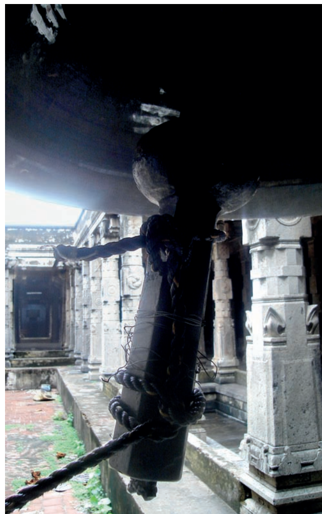
Dispositifs de cloches, grand temple de Chidambaram, 2008.

donnés. La concentration du pujari [officiant à la puja ] ne sera pas perturbée. C'est le son humain, excepté pour le pujari à l'intérieur [du sanctuaire à la divinité] ; les autres sons sont inutiles, par exemple, le fait de commenter ce que quelqu'un est en train de faire ou sur n'importe quel sujet, parler de politique, etc. Tu sais, lorsque les gens vont au temple, il y a du monde, les gens ont l'habitude de parler, de discuter sur ce qu'il s'est passé, en terme d'alliance [dans la famille] : « — Comment va ta fille ? », « — Elle est en stage », répondent-ils, comme ça. Les gens ont l'habitude de discuter. Durant la puja , tu dois te concentrer sur Dieu, sur ce que tu vois. Et tu ne dois pas être