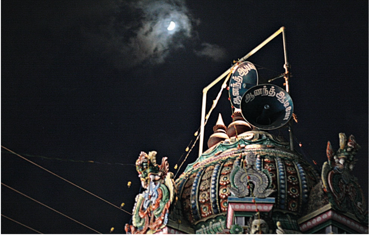
Mégaphones diffusant des chants de dévotion, temple de quartier, Chidambaram, 2008.

parler, mais comme un événement sonore «faste» ou «de bon augure» ( mangala vadyam ) accompagnant son déroulement général. Du fait de cette distinction, visible aussi dans la distribution spatiale du culte, la controverse autour de l'automate s'est ainsi rapidement dissipée.