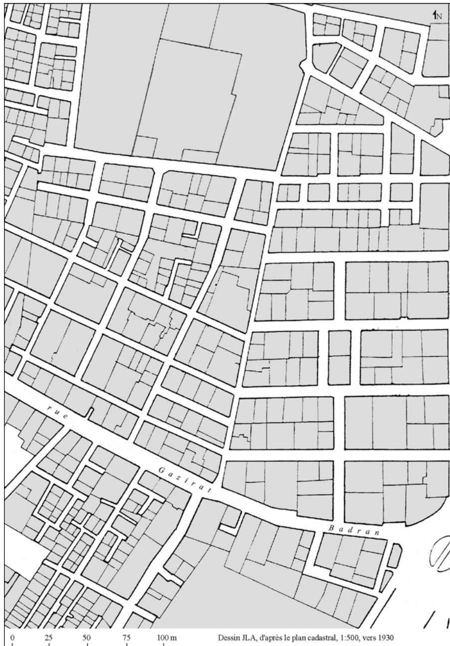
Fig. 2. Parcellaire de Chubra, un quartier loti à la fin du XIX e siècle dans une zone d'exploitations agricoles et de jardins

Cette nouvelle forme de composition ne signifie pas que Le Caire d'avant 1876 était homogène. Les nouveaux quartiers d'Ismail sont, eux aussi, fortement hiérarchisés.