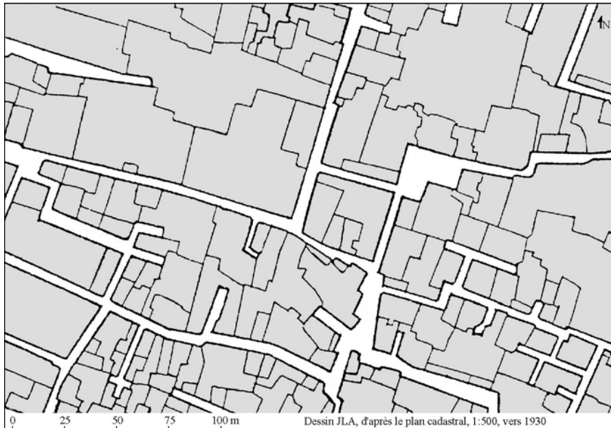
Fig. 3. Découpage parcellaire de la vieille ville

La répartition de leurs habitants montre bien qu'une forte ségrégation est déjà en œuvre dès la fin des années 1860. Par contre dans le tissu ancien, les concentrations d'activités ou de groupes sociaux semblent alors composées sur un « fond » dont la distribution de l'espace favorise la multiplicité (fig. 3).