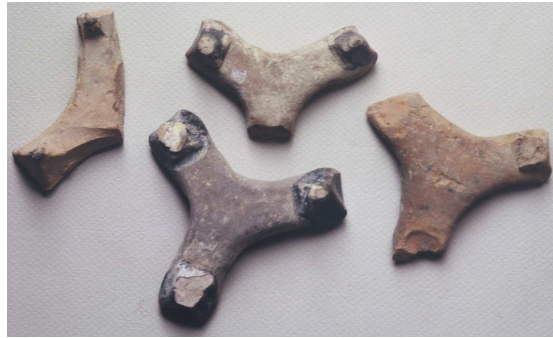
Fig. 1 : Pernettes

Cette opération est délicate car il convient tout à la fois de remplir le four de façon compacte afin de minimiser la perte de chaleur et de rentabiliser la fournée, sans toutefois entasser les céramiques glaçurées au risque de les retrouver collées les unes aux autres. Des tessons de pièces manquées disposés entre les objets contiguës et de petits cylindres d'argile grossière permettaient jusqu'alors d'éviter ces incidents ; ils sont avantageusement remplacés par les pernettes dont l'utilisation à Byzance se généralise sans toutefois devenir systématique 13 (Fig. 2).