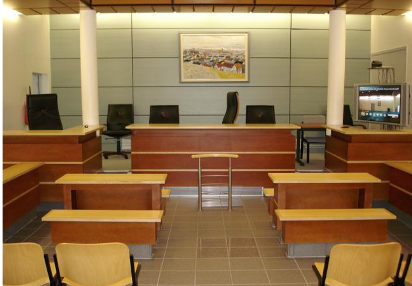
Figure 1 : Le prétoire de Saint-Pierre et Miquelon, vu du fond de la salle, près de l'entrée du public. Au premier plan, les chaises du public, puis les bancs des avocats et des parties, la barre. A gauche au fond le bureau du procureur. En face au fond celui du ou des juges. Enfin on notera à droite, face au bureau du procureur, le dispositif de visioconférence, installé de manière permanente dans la salle.

Avant l'entrée des juges, les membres de l'audience sont dispersés dans des engagements divers, mais leur position rend lisible l'activité à venir. En remplissant ce qui apparaît alors une position focale mais vide (le bureau surélevé au fond et au centre de la salle d'audience) l'entrée des juges vient compléter la scène. La paire d'actions que constituent l'acte de langage inaugural du président et l'alignement ostensible de l'attention et des actions du public anime un tableau, intelligible d'un seul coup d'œil comme une audience en prétoire, du fait de la disposition des participants dans un espace cadré et « préparé » pour cette activité.