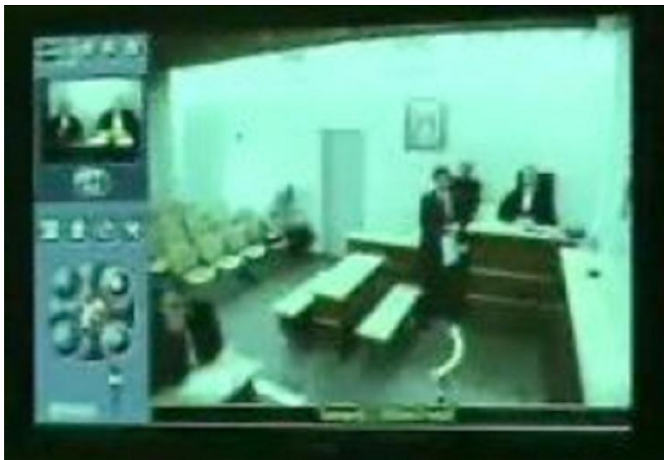
Figure 3 : Image visible du côté parisien à la connexion. Le procureur (en robe) est assis à droite, à sa place habituelle, avec le greffier du tribunal de Saint-Pierre et Miquelon qui se tient debout à sa gauche. Devant eux, debout, le président du Tribunal Supérieur d'Appel (qui ne joue pas de rôle dans l'audience à venir En dehors du fait qu'il s'agit d'une audience de la juridiction qu'il préside). Assis au fond de la première rangée de sièges, la personne dont l'affaire est sur le point d'être traitée. En bas à gauche, un avocat (en robe) qui représente des « témoins assistés » et absents. Dans l'image de contrôle, en haut à gauche, le président et le greffier parisiens. La qualité de l'image présentée ici a été dégradée par rapport à celle effectivement visible à l'écran, pour des raisons de confidentialité.

Certaines audiences à distance décalquent presque à l'identique l'organisation séquentielle de la séquence canonique d'ouverture de l'audience en prétoire. Cela arrive pour des audiences de première instance, dans des affaires présidées par un juge unique. Tout le tribunal siège à Saint Pierre et Miquelon, à l'exception d'un avocat qui se connecte de Paris. Dans ce cas, l'ouverture de l'audience se fait selon une séquence du type :