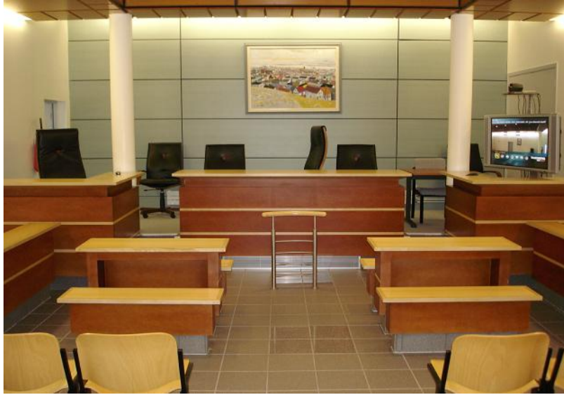
Figure 1 : Le prétoire de Saint-Pierre et Miquelon, vu du fond de la salle, près de l'entrée du public. Au premier plan, les chaises du public, puis les bancs des avocats et des parties, la barre. A gauche au fond le bureau du procureur. En face au fond celui du ou des juges. Enfin on notera à droite, face au bureau du procureur, le dispositif de visioconférence, installé de manière permanente dans la salle.

Avant l'entrée des juges, les membres de l'audience sont dispersés dans des engagements divers, mais leur position rend lisible l'activité à venir. En remplissant ce qui apparaît alors une position focale mais vide (le bureau surélevé au fond et au centre de la salle d'audience) l'entrée des juges vient compléter la scène. La paire d'actions que constituent l'acte de langage inaugural du président et l'alignement ostensible de l'attention et des actions du public anime un tableau, intelligible d'un seul coup d'œil comme une audience en prétoire, du fait de la disposition des participants dans un espace cadré et « préparé » pour cette activité.