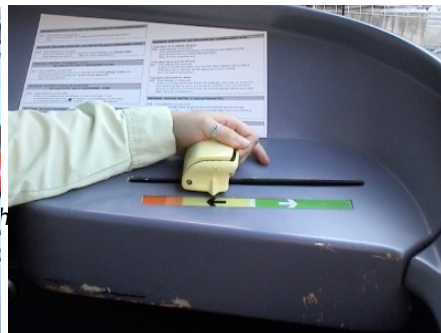
Manipulateur traction/freinage avec la commande de veille sur le Tramway Français Standard du réseau de la RATP.