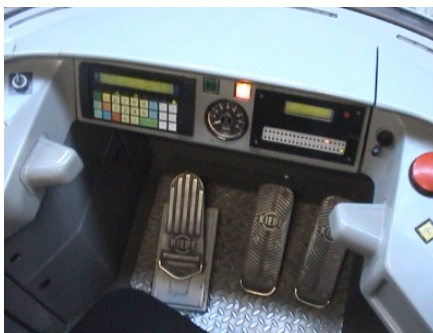
Poste de conduite du tramway de Saint-Étienne. À droite les pédales d'accélération et de freinage ; à gauche, pédale d'activation de la veille

Un premier constat s'impose : dans tous les réseaux, le système d'homme mort est, en premier lieu, lié au système de commande de la traction et du freinage. Quand, il est manuel, c'est-à-dire sous la forme d'un manipulateur de traction, l'activation du système d'homme mort lui est associée directement. Quand les commandes sont au pied, par l'intermédiaire de deux pédales, l'une