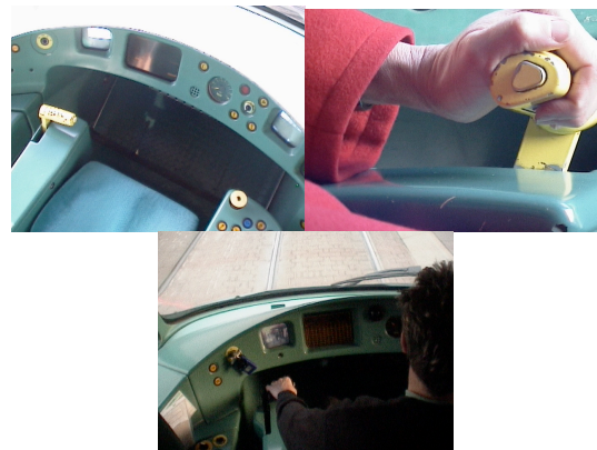
Photos 9 à 11 : poste de l'Eurotram, manipulateur de traction, sonnette et veille, action sur le manipulateur

À Strasbourg, ville équipée de l'Eurotram, le manipulateur, situé sur l'accoudoir gauche du siège du conducteur (photo 9), ne donnait pas satisfaction en particulier du fait de la quasi-impossibilité de se servir de l'accoudoir, pour reposer l'avant-bras en même temps que l'on se sert du manipulateur (photos 10 et 11). De plus, la présence et la disposition de la clochette et du dispositif de veille sur le manipulateur contraignent fortement la position de la main et de l'avant-bras, ce qui a été l'objet de critiques. Le modèle retenu s'inspire de la commande par « joystick » en vigueur sur le tramway Combino produit par Siemens. Il est à noter que, sur le Combino circulant à Fribourg en Allemagne, ce manipulateur, sert également au contrôle de la vigilance du conducteur. Les commandes de traction et de freinage se substituent à l'activation d'un dispositif autonome de type « homme mort ». Quand le tram roule sur l'erre, c'est-à-dire lorsqu'il n'y a aucune action sur le manipulateur, le conducteur doit le maintenir enfoncé. Toutefois, cette idée d'utiliser directement, et non pas en lui associant un dispositif spécifique, le manipulateur de traction/freinage comme source d'information sur la présence active du conducteur, si elle a été évoquée n'a pas été retenue pour des raisons « techniques ».