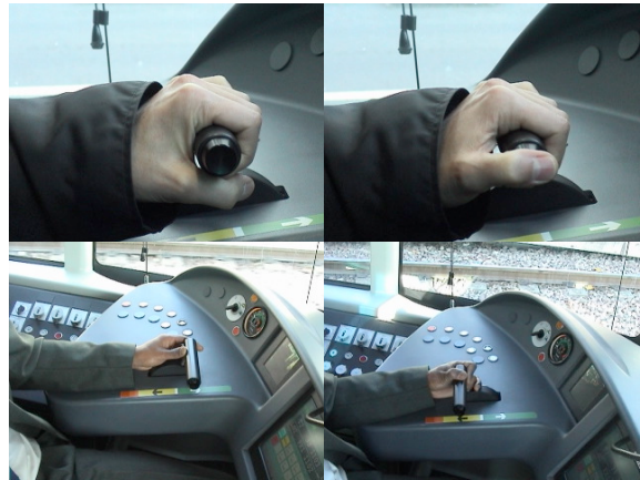
Photos 5 à 8 : manipulateur rotatif du Citadis avec son usage théorique et son usage pratique

Cette remise en cause a abouti à la production d'un manipulateur rotatif doté d'un contact sensible pour la veille. Mais on constate que le « script » d'action que la forme de l'objet veut prédéterminer (Akrich 1987), saisie du manipulateur à pleine main et contact avec le pouce (photos 5 et 6), ne se réalise pas effectivement. La prise latérale et en pince est souvent préférée (photos 7 et 8), associée à l'actionnement d'une pédale de veille qui avait été demandée par les conducteurs. Dès lors, le fait que l'actionneur de la veille associé au manipulateur ne soit plus accessible ne pose pas de problème. En conséquence, il n'y a pas de retour critique sur la conception du manipulateur même si son usage ne correspond pas aux attentes des concepteurs.