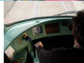
Photos 9 à 11 : poste de l'Eurotram, manipulateur de traction, sonnette et veille, action sur le manipulateur

Dans cette redéfinition de la commande de traction/freinage autour d'un joystick, la possibilité