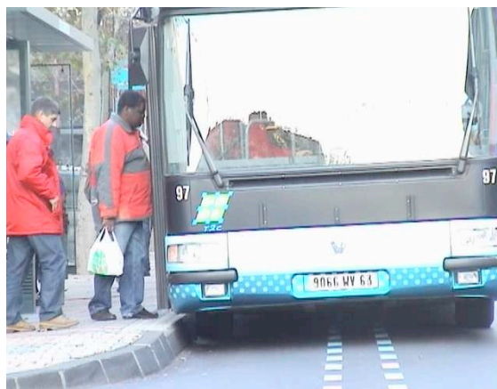
Fig 6. Accostage au plus près du quai, le guidage étant désactivé le tracé du guidage décentré montre la meilleure performance du conducteur en conduite manuelle

du monde, j'arrive loin et je me rapproche un peu. Cette technique permet aussi un alignement parfait, meilleur même qu'avec le guidage, la lacune entre le bas de caisse et le quai étant réduite à 2 ou 3 cm, au lieu des 5 à 7 cm associés à la trajectoire guidée (figure 6). Les trajectoires associées au guidage impliquent au contraire une approche précoce du quai, quelles que soient donc les conditions d'attente des voyageurs « Déjà, pour éviter les jeunes il faut arriver large et se serrer après. Et, à C, avec le guidage, on arrive serré. » Le guidage force donc à emprunter une trajectoire que spontanément les conducteurs n'emprunteraient pas, il induit des pratiques contre professionnelles.