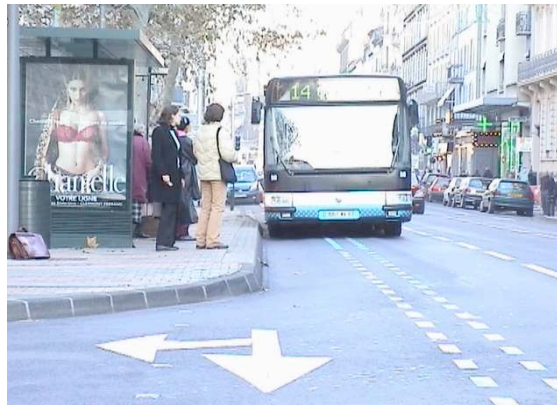
Fig 2. Bus Agora articulé équipé d'une caméra et tracé du guidage au sol

(A2), le guidage est présent sur une partie des stations, en tant qu'aide à l'accostage, et sur un tronçon de ligne d'environ 800 m, en site propre, avec deux stations desservies, où il s'apparente donc à un tramway.