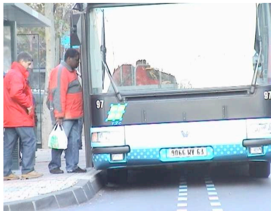
Fig 6. Accostage au plus près du quai, le guidage étant désactivé le tracé du guidage décentré montre la meilleure performance du conducteur en conduite manuelle

du monde, j'arrive loin et je me rapproche un peu. » Cette technique permet aussi un alignement parfait, meilleur même qu'avec le guidage, la lacune entre le bas de caisse et le quai étant réduite à 2 ou 3 cm, au lieu des 5 à 7 cm associés à la trajectoire guidée (figure 6). Les trajectoires associées au guidage impliquent au contraire une approche précoce du quai, quelles que soient donc les conditions d'attente des voyageurs. « Déjà, pour éviter les jeunes il faut arriver large et se serrer après. Et, à C, avec le guidage, on arrive serré. » Le guidage force donc à emprunter une trajectoire que spontanément les conducteurs n'emprunteraient pas, il induit des pratiques contre professionnelles.