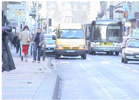
Fig 4. Présence d'obstacle à l'approche d'une zone guidée : l'insertion dans le guidage est gênée par l'obstacle à éviter

Lorsque ces conditions deviennent par trop contraignantes, les conducteurs dérogent à la règle «Je suis dans le guidage, il y a un obstacle, je décroche manuellement, je passe l'obstacle et je me remets en guidage. C'est une chose qu'on n'a pas le droit de faire et je crois qu'on le fait tous.»