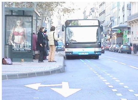
Fig 3. Approche de station dans une configuration où le guidage est inactif : trajectoire décalée par rapport au tracé du guidage

Le confort et la sécurité des voyageurs sont des éléments déterminants de la conduite. Le contrôle du freinage, pour éviter des décélérations trop brutales, et de la trajectoire, pour éviter les contre-braquages trop brusques et les effets de ballottements, visent à limiter les risques de chute dans le véhicule. Certains tracés peuvent contredire ces objectifs, soit parce qu'ils diminuent les marges de manoeuvre des conducteurs, comme indiqué précédemment, soit parce qu'ils empruntent des courbes trop serrées ou qu'ils zigzaguent là où les conducteurs savent adopter une trajectoire plus souple (Figure 3) : « Pour ne pas faire la boucle, on est obligé de bien viser.