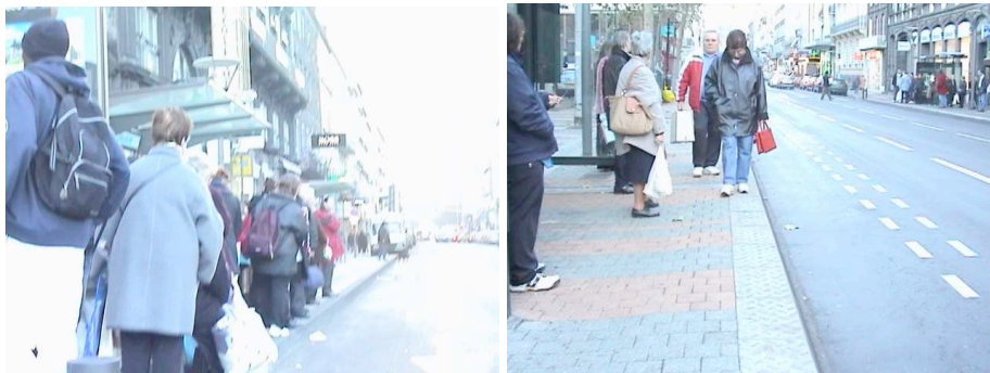
Fig 5. Les voyageurs en attente aux quais ou les piétons circulant sur les trottoirs : des «obstacles» à prendre en compte à l'approche en station

Les voyageurs pris en compte par les conducteurs ne sont pas seulement ceux qui sont dans le véhicule mais aussi ceux qui attendent à l'arrêt en station. De ce point de vue, les contraintes induites par le guidage apparaissent plus importantes. Les voyageurs ont en effet tendance à se rapprocher du bord du quai et les conducteurs craignent de les toucher s'ils se rapprochent trop vite du quai (figure 5). Cette inquiétude est partagée par les conducteurs de l'agglomération A1 qui considèrent pourtant que la conception des stations et du tracé est plutôt satisfaisante.