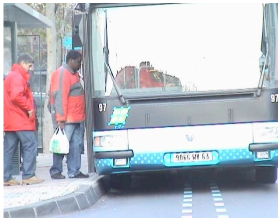
Fig 6. Accostage au plus près du quai, le guidage étant désactivé le tracé du guidage décentré montre la meilleure performance du conducteur en conduite manuelle

du monde, j'arrive loin et je me rapproche un peu. » Cette technique permet aussi un alignement parfait, meilleur même qu'avec le guidage, la lacune entre le bas de caisse et le quai étant réduite à 2 ou 3 cm, au lieu des 5 à 7 cm associés à la trajectoire guidée (figure 6). Les trajectoires associées au guidage impliquent au contraire une approche précoce du quai, quelles que soient donc les conditions d'attente des voyageurs. « Déjà, pour éviter les jeunes il faut arriver large et se serrer après. Et, à C, avec le guidage, on arrive serré. » Le guidage force donc à emprunter une trajectoire que spontanément les conducteurs n'emprunteraient pas, il induit des pratiques contre professionnelles.