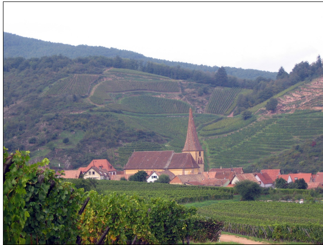
Photo n° 1 : Le village de Niedermorschwihr et ses coteaux viticoles en Alsace. Cliché R. Schirmer, 2006.

de nombreuses vignes sur les pentes des montagnes, le long des vallées, ou sur les reliefs dominants (photo n° 1).