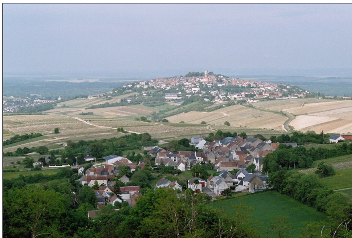
Photo n° 2 : Le vignoble de Sancerre avec la Loire en arrière-plan. De nombreux villages se côtoient.

La présence de fortes communautés humaines est sans doute l'une des caractéristiques qui marquent le plus les paysages de vignobles. Comme la culture de la vigne nécessitait une main d'œuvre dense et permettaient de faire vivre des exploitants sur de petites superficies, les régions de vignobles sont toutes marquées par des paysages fortement humanisés (photo n° 2). Les bourgs prennent parfois des allures de petites villes, avec un aspect souvent beaucoup plus souriant que dans les espaces limitrophes.