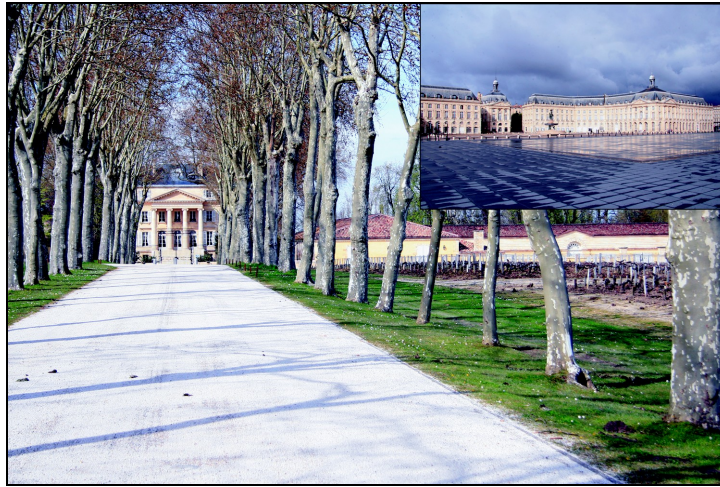
Photo n° 3 : Les paysages du vignoble bordelais, un prolongement de la ville (château Margaux et la place de la Bourse à Bordeaux) Cliché R. Schirmer, 2008.

plus célèbre est sans doute le vignoble de Montmartre à Paris. Mais surtout, les rapports ville-campagne se sont modifiés.