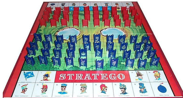
Figure 3. Plateau de Stratego en début de partie

mouvement d'une variété de pièces un peu plus importante qu'aux Échecs , de jouer sur des variations de poids, de force d'influence, de considérer que certaines cases ne sont accessibles par aucun des camps en présence et de se représenter explicitement l'ensemble de ses pièces en supposant que l'adversaire dispose d'une force équivalente sans être réellement sûr des positions qu'il a choisies. En outre, la position de l'objectif du joueur de Stratego lui est inconnue et protégée par des pions adverses. Ce jeu peut donc servir pour des analogies où l'objectif à atteindre est assez flou et que les choix adverses le sont en partie aussi.