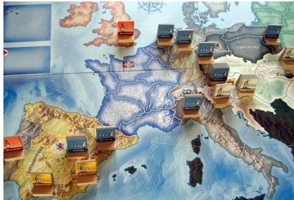
Figure 8. Exemple de carte à zones de jeu ( Age of Napoleon ) 10

Il peut être « abstrait » comme aux Échecs et au Go ou cartographique, c'est-à-dire représentant une réalité géographique comme au Risk (le planisphère) ou à Great Battles of Alexander (une carte représente les caractéristiques d'un terrain réel).