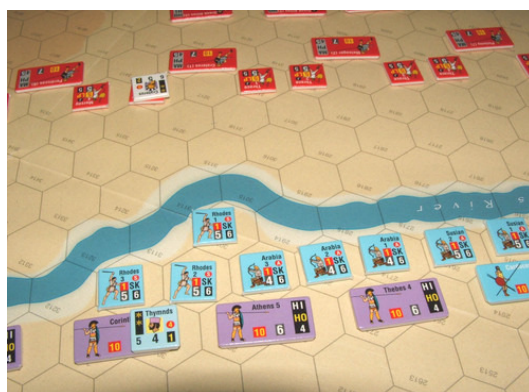
Figure 5. Exemple de reconstitution de la bataille d'Issus à Great Battle of Alexander

Dans la deuxième catégorie, nous retrouvons des jeux où ce sont les intersections de lignes qui servent de repères pour placer les pièces comme dans le cas du Go ou du Xiang Qi 7 (les Échecs chinois), ou encore des wargames comme Paths of Glory , même si une figure géométrique (carré ou étoile) précise le point d'intersection.