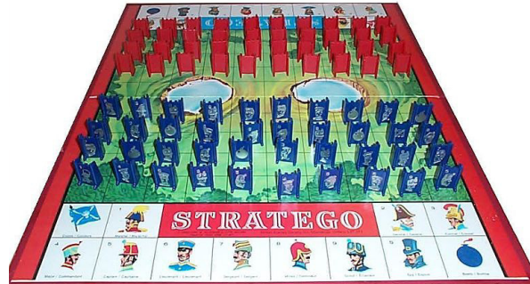
Figure 3. Plateau de Stratego en début de partie

mouvement d'une variété de pièces un peu plus importante qu'aux Échecs , de jouer sur des variations de poids, de force d'influence, de considérer que certaines cases ne sont accessibles par aucun des camps en présence et de se représenter explicitement l'ensemble de ses pièces en supposant que l'adversaire dispose d'une force équivalente sans être réellement sûr des positions qu'il a choisies. En outre, la position de l'objectif du joueur de Stratego lui est inconnue et protégée par des pions adverses. Ce jeu peut donc servir pour des analogies où l'objectif à atteindre est assez flou et que les choix adverses le sont en partie aussi.