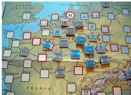
Figure 6. Exemple de carte à points de jeu ( Paths of Glory 8 )

Nous pouvons aussi distinguer les jeux selon que leurs pièces soient visibles par un seul joueur ( Stratego , Age of Napoleon ) ou tous les joueurs ( Échecs , Go , Risk , etc.). Le nombre d'informations distinctes (les valeurs lisibles sur chaque pièce) affichées sur les pions peut aussi permettre de distinguer les différents jeux qui existent. Ainsi, nous avons des jeux où il n'y a qu'une information sur la pièce qui permet de reconnaître son camp d'appartenance (un pion noir au Go , la face blanche d'un pion à Othello ). Ils peuvent aussi présenter deux informations représentées le plus souvent par la couleur et la forme de la pièce (au Risk la forme de la pièce indique la taille de l'unité qu'elle représente, tandis qu'aux Échecs elle indique sa capacité de mouvement). Depuis que les wargames commerciaux se sont développés, l'utilisation de pions cartonnés ( counters en anglais) s'est largement répandue. Ce sont généralement des pièces carrées de 1,25 cm de côté (ou quelquefois pour des unités moins mobiles, des rectangles de 1,25 cm de large pour 2,50 cm de long) représentant une unité militaire ( Great Battles of History ou Paths of Glory ) et ses caractéristiques (type d'unité, taille de l'unité, capacité de mouvement, valeur en attaque, valeur en défense, capacité spéciale, etc.).