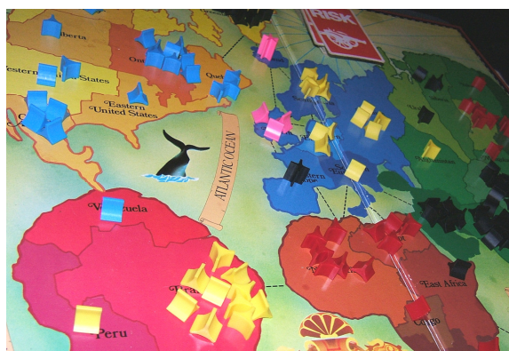
Figure 4. Exemple de partie de Risk en cours

L'analogie entre le décideur et le joueur de Risk est simple à effectuer. Ces principes stratégiques sont ceux de bases de nombreux ouvrages de stratégie militaire (économie et concentration de forces, réserve stratégique, savoir de temps en temps prendre des risques et tenter sa chance, etc.) et plusieurs auteurs ont déjà fait le parallèle entre stratégie militaire et stratégie d'entreprise. Concernant l'analogie au plateau du Risk , ce dernier peut, au minimum, réaliser le parallèle d'un développement en termes de marchés géographiquement déterminés. Nous pouvons aussi illustrer cette analogie possible en reprenant les principes de stratégie du Risk en remplaçant le terme « zone » par ceux de « marché », « segment de marché » ou « secteur d'activité ». Ce jeu permet aussi de représenter la continuité et l'interdépendance de certains segments de marchés et de relativiser les chances de réussites d'un faible déploiement de moyens dans un secteur donné.