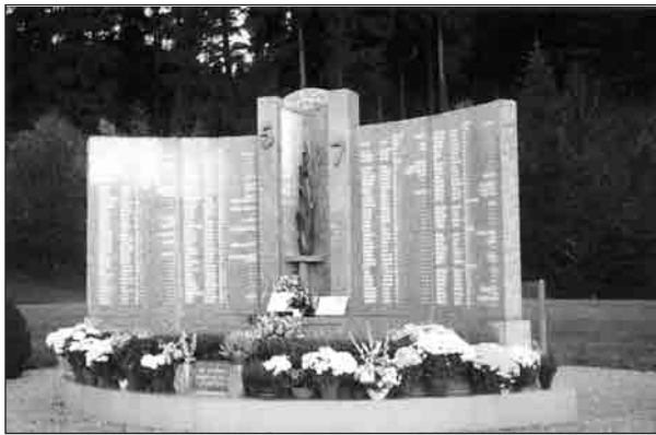
Mémorial de l'incendie du 5/7.

toire – un drame qui a touché dans leur majorité des familles ne résidant pas sur place. La question de l'origine de l'incendie fut évidemment posée et celle des responsabilités à imputer. Des rumeurs d'attentats – règlement de compte entre bandes rivales ou racket qui aurait mal tourné – ont surgi, venant concurrencer la thèse qui a été retenue par la suite d'un accident dû à une suite d'erreurs, de négligences administratives, de défaillances techniques et à l'utilisation de produits inflammables pour la construction. Le maire, qui a donné le permis de construire, a été alors impliqué dans la recherche de responsabilité. Il a été soutenu par ses concitoyens et plusieurs maires ont démissionné par solidarité pour signifier leur opposition radicale à la jurisprudence qui se dessinait alors impliquant directement sa responsabilité individuelle. Les habitants de la commune ont été solidaires de la municipalité et certains ont accusé même les parents d'avoir laissé sortir leurs enfants alors que toutes les conditions pour le faire n'étaient pas réunies (enfants mineurs, dancing mal fréquenté, veille de la Toussaint...). Les familles des victimes de leur côté n'ont jamais souscrit à la thèse de l'attentat et ont très rapi-