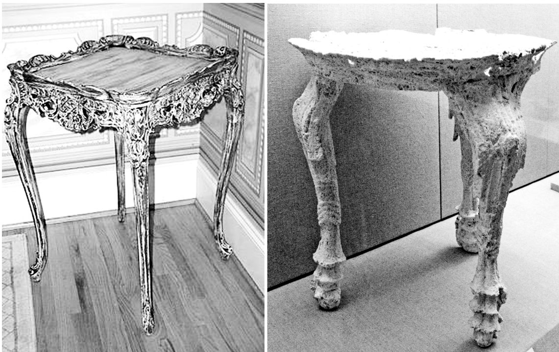
Fig.2. La permanence des styles est une force historique d'une inertie considérable dont voulaient s'échapper les modernes. A gauche un guéridon Louis XV. A droite une table du 17ème siècle avant Jésus Christ obtenue en coulant du plâtre dans un vide trouvé dans la cendre qui recouvrit la ville minoenne du Sud de l'île lors de l'éruption du volcan de Santorin.

En architecture, il est une rupture qu'on peut situer précisément entre le Jugend Styl de la Vienne de la fin du 19ème siècle et le mouvement moderne du début du 20ème siècle (De Stijl en Hollande et Art Nouveau). La question qui se pose à Le Corbusier, J.J.P. Oud, Dudoc, Rietveld, etc., est de casser la permanence des styles : échapper à une lecture signifiante de l'architecture (comme le classicisme avec ses frontons, pilastres, corniches, etc.) sans adopter un nouveau style qui viendrait succéder aux styles Renaissance, baroque, etc. 4