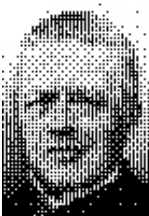
Fig.5. Cournot, image dont est tirée celle du début de l'article.

De notre fréquentation de Cournot et de Lacan, nous pouvons finalement poser la thèse suivante : mathématiser les risques, c'est immobiliser le processus interprétatif et clore le recueil des données fortuites pour décrire un champ de possibles fixe, provisoirement non perturbé par la quête de compréhensions nouvelles . Une grave erreur serait de prendre le résultat de cette mathématisation comme le domaine du rationnel.