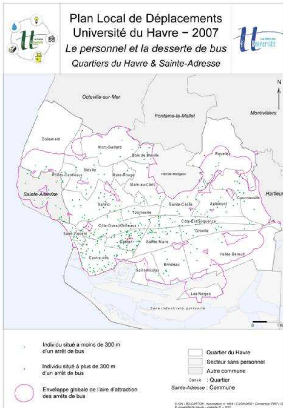
Figure n°2 : Potentiel de report modal théorique vers le bus pour les personnels

des bus, près de 53% des agents sont susceptibles d'utiliser ce mode de transport. Replacé dans la logique des mobilités urbaines, et en considérant les seuls membres du personnel établis dans l'agglomération, ces possibilités de changement de pratiques apparaissent plus fortes encore.