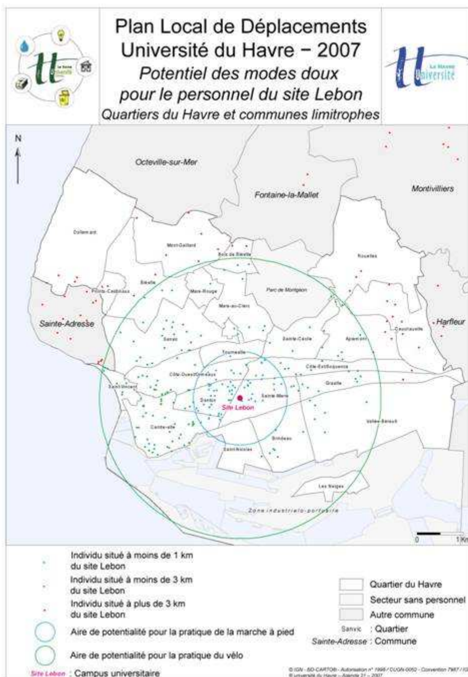
Figure n°1 : Potentiel théorique de l'usage des modes doux pour le personnel

La localisation à l'adresse (numéro et nom de rue du lieu de résidence au cours de l'année universitaire) de l'ensemble des étudiants inscrits à l'université et de tous les personnels à leur domicile constitue la base élémentaire de cette réflexion. Elle permet avec la localisation précise des sites et des bâtiments qui composent l'université d'intégrer les deux extrémités, les deux nœuds de la relation Domicile/Travail. En intégrant ensuite les lignes et les arrêts de bus, la voirie, les pistes cyclables, les gares et les voies ferrées, ce sont les maillons de cette chaîne qui sont alors restitués. Le croisement de ces éléments permet ensuite, mode par mode, de définir les possibilités de report modal sur la base d'une approche combinée de l'offre et de la demande potentielle.