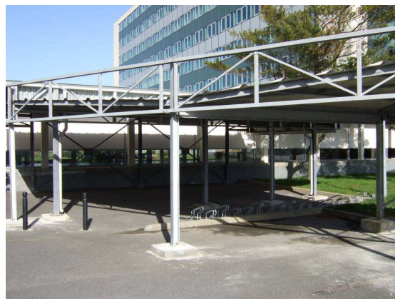
Figure n°7 : Des sites inégalement équipés pour accueillir les cyclistes

Enfin, les résultats de l'enquête en témoignent : pour les usagers de l'université, étudiants comme agents, l'amélioration de l'offre de pistes cyclables pour accéder aux sites doit être une priorité. Le réseau actuel ne permet pas une desserte des quatre sites et constitue un frein, un obstacle au développement plus important du vélo compte tenu des problèmes de rapidité des déplacements mais aussi de sécurité. La ville du Havre travaille actuellement sur l'extension et l'amélioration de son réseau de pistes cyclables. L'association de l'université à cette réflexion apparaît nécessaire pour permettre une meilleure desserte de ses différents sites. Apporter des éléments de réponse à cette question est un enjeu majeur pour réduire la distance qui existe aujourd'hui encore entre les potentiels modaux, tels qu'appréhendés par l'approche SIG, et la réalité des faits, celle des pratiques individuelles.