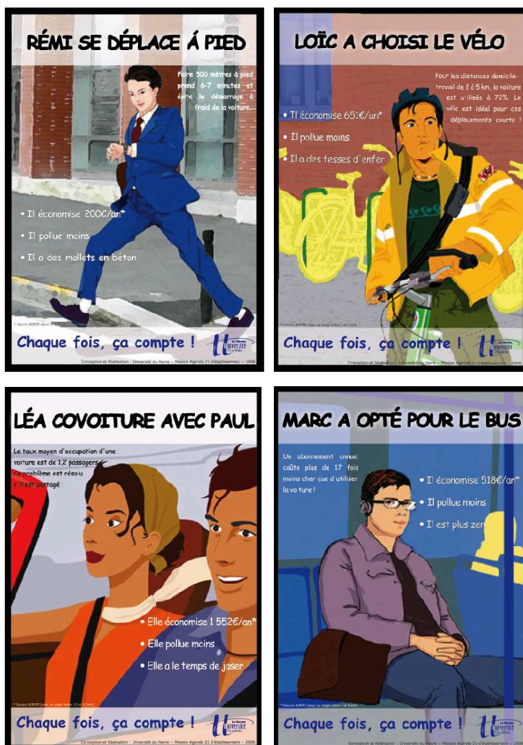
Figure n°4 : Affiches de promotion des modes alternatifs

Cette seconde opération prend la forme de quatre supports graphiques thématiques prônant les avantages de la marche à pieds, du vélo, du bus et du covoiturage en terme de coûts et d'aménités environnementales.