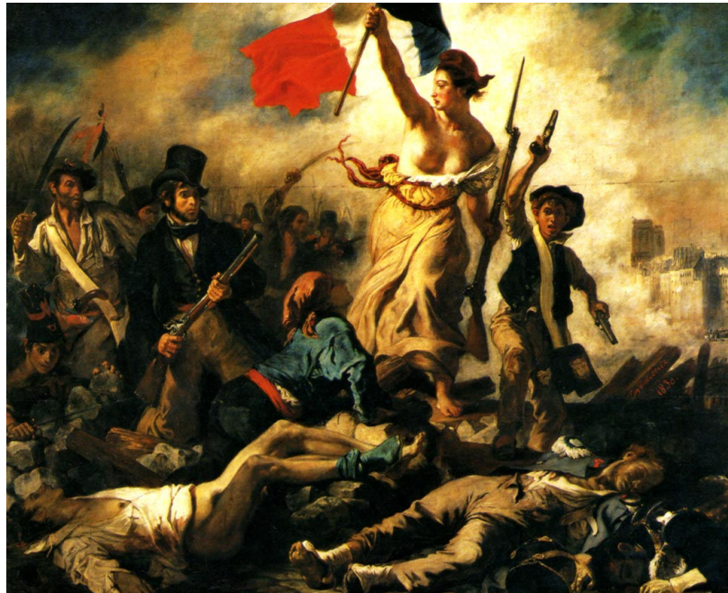
La liberté guidant le peuple – Delacroix (1831) – Musée du Louvre