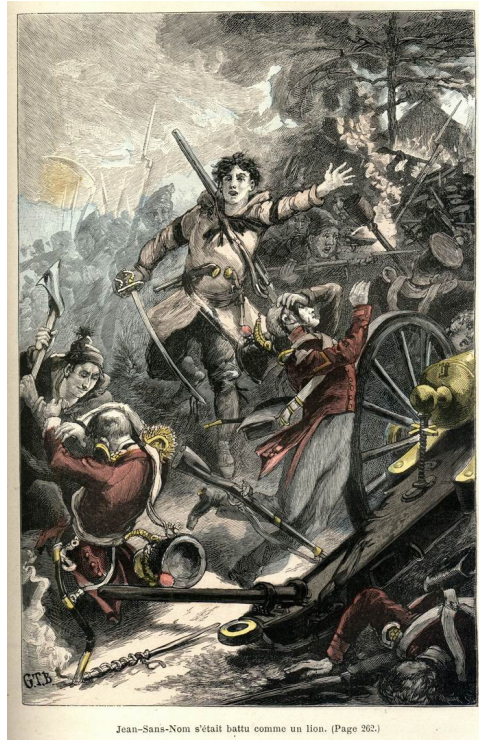
« Jean-Sans-Nom s'était battu comme un lion » – Jules Verne – Famille-Sans-Nom (1889) – Chapitre II, Deuxième Partie. http://www.jules-verne-club.de/Kaleidoskop/Chromotypo_11.html