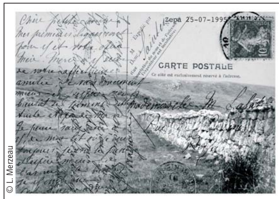
Souvenirs (imaginaires) d'Europe centrale ≠ Zepa 2001

On l'aura compris : cette nouvelle économie mémorielle excède de loin la seule question du stockage. Si les machines informatiques permettent une augmentation exponentielle