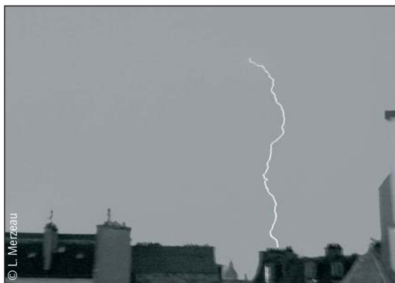
Au jour le jour, 26 juin 2001

cordon de lumière ombilical qui la reliait à un corps, et restaurer la coupure sémiotique suspendue par la « parenthèse indicielle 4 » de la photographie. Dans un univers où toute forme peut être codée dans un langage binaire, « il ne peut plus y avoir la moindre naturalité du signe, qui est toujours construit de façon arbitraire 5 ». Croyance