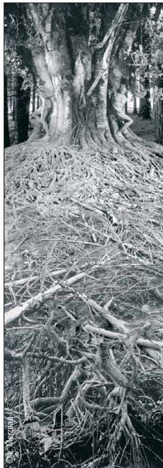
Strates ≠ Les captifs, 1999

À mesure que se développeront les savoirs – intuitifs ou construits – sur les conditions de production des images, on peut cependant espérer que cette ère du soupçon débouche sur une confiance renouvelée. Accepter que le réel n'est connaissable qu'à travers les traitements qu'on lui applique ne signifie pas qu'il soit hors d'atteinte, pas plus qu'une conscience accrue des modalités de la construction du vrai n'annule toute vérité. Du moins pas si ces techniques de traitement font l'objet d'une véritable appropriation, à la fois individuelle et collective. C'est en effet lorsque l'accès aux images n'est pas couplé à un savoir et à un faire qu'elles deviennent potentiellement mensongères. Car « lire véritablement, c'est écrire, ou lire à partir d'un pouvoir-écrire ; et voir véritablement, c'est montrer, ou voir à partir d'un pouvoir-montrer 8 ». En régime analogique, le travail de décodage