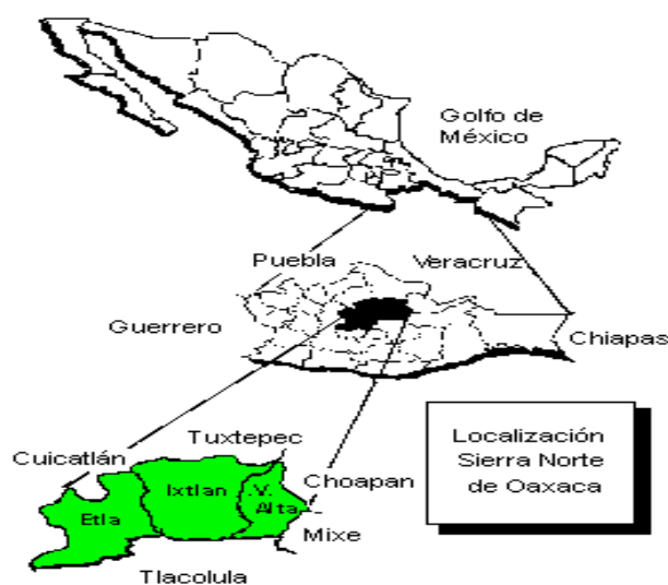
Carte 2 : La Sierra de Juarez dans l'État de Oaxaca

Si la Sierra Norte de Oaxaca est bien aussi une région forestière dont la population est très majoritairement indigène (Zapotèques, Chinantecs, Mixes et Mazatèques essentiellement, etc.) 11 , elle se distingue nettement de la Selva Lacandona par une relative richesse et une certaine homogénéité socio-environnementale qui auraient facilité la mise en cohérence recherchée par les différentes initiatives de développement durable.