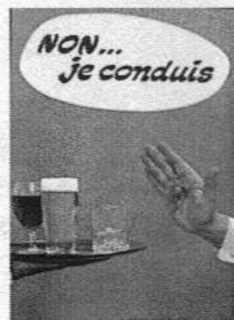
Non... je conduis, CSSR, Ministère des Communications, Via Secura, Belgique, 1970.