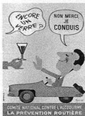
Encore un verre ? Non merci, je conduis, G. Nicolitch, CNDCA/Prévention routière, France, 1968.