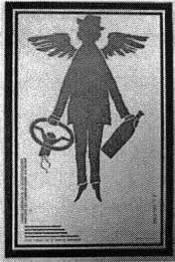
Conducteur ailé, J.-L. Huens, Conseil supérieur de la sécurité routière – Via sicura, Belgique, 1972?