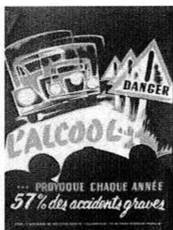
L'alcool provoque... 57% des accidents graves, Farin, CNDCA, France, 1955.