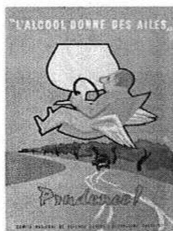
L'alcool donne des ailes... Prudence !, Jack Sey, CNDCA, France, 1963.