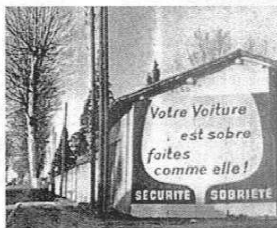
Affichage routier du Haut Comité d'Étude et d'Information sur l'Alcoolisme, France. Photo extraite du rapport d'activité du HCEIA, 1958.