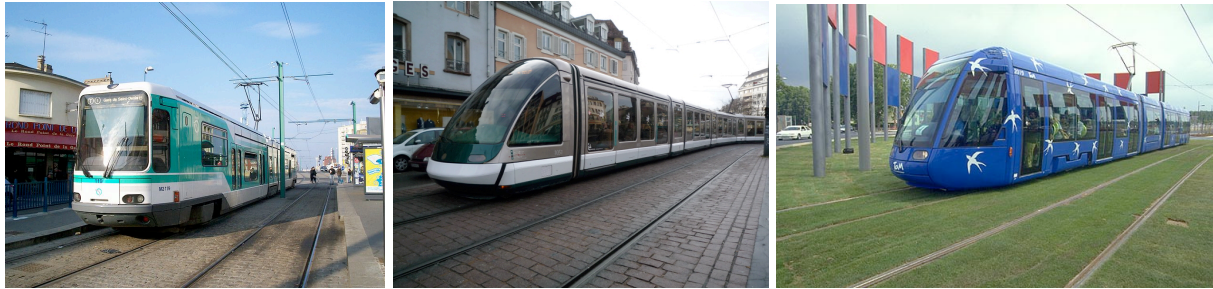
TFS de la Région parisienne (1992), Eurotram strasbourgeois (1994), Citadis de Montpellier (2000)

Ce tramway imposera sa conception comme norme pour tous les constructeurs. En particulier le plancher bas et les baies vitrées deviendront un argument décisif pour espérer remporter des appels d'offre. Pour cette raison, Alstom abandonne son Tramway français standard (TFS) et met en chantier le Citadis.