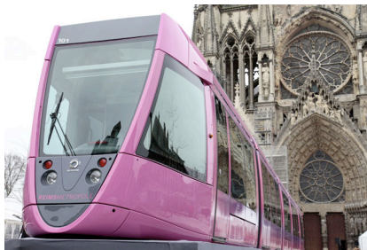
Tramway de Reims,

À regarder passer les tramways dans les rues des villes de France, on est souvent saisi par leur esthétique. En particulier, leur face avant semble déployer une figure totémique de la Ville censé probablement la protéger dans son avancée vers la modernité. Les références anciennes, quasi intemporelles, sont actualisées dans le tramway et parcourent la ville pour annoncer cette nouvelle ère.