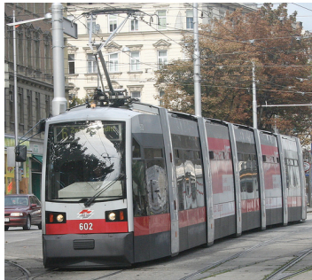
Tramway de Wien,

Cette « french touch » s'accompagne corrélativement d'une forme de mépris pour ceux qui n'ont pas eu à réinventer le tramway. Le directeur du design d'Alstom juge ainsi les autres tramways : « Les Allemands, eux, avaient gardé leurs tramways. Ils ont continué avec des boîtes de conserve » (X. Allard).