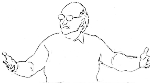
Fig 2 : Tenue gestuelle pendant la pause de 1200 ms (après « c'est un état »)

La longue pause orale qui suit (1200 ms) coïncide de manière très exacte avec une « tenue gestuelle », car le geste de retour est suspendu, aux sens propre et figuré du terme :