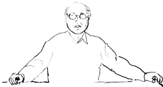
Fig. 3 : Pause posturo-gestuelle entre « mais ↑ » et « il faut savoir être heureux »

Ce n'est qu'au moment précis où l'énoncé reprend que s'opère le retour du geste vers la position de repos ; ce retour du geste enjambe la pause orale située entre le ponctuant « bon » et le ligateur « mais » qui amorce le préambule de l'unité suivante. Or, contrairement à nos attentes, pendant la pause interne qui sépare « mais » de la suite du préambule, les deux mains arrivent en position de repos et y restent. On observe ici, en plus d'une vraie pause gestuelle, une vraie immobilité posturale (une sorte de pause posturo-gestuelle).