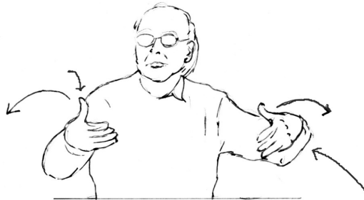
Fig 1 : Geste pendant « c'est un état »

La pause orale qui sépare le préambule « être heureux » du rhème « c'est un état » coïncide avec une tenue gestuelle, qui semble illustrer à la fois la démarcation entre les deux constituants et la solidité du lien logique entre eux. Le rhème « c'est un état » correspond au geste suivant qui se déroule en deux temps : armement du geste (convergence des deux mains), puis ouverture des deux mains, amenant à une position que l'on peut interpréter comme manifestant l'évidence (pour le locuteur) de l'assertion formulée.