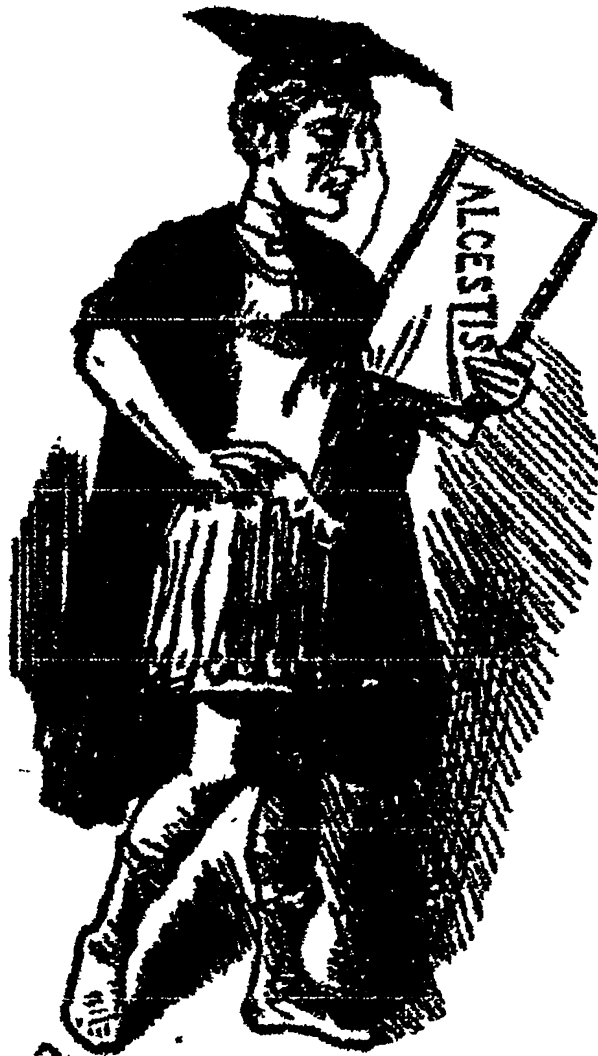
Drs Classic Costume revived at Oxford.