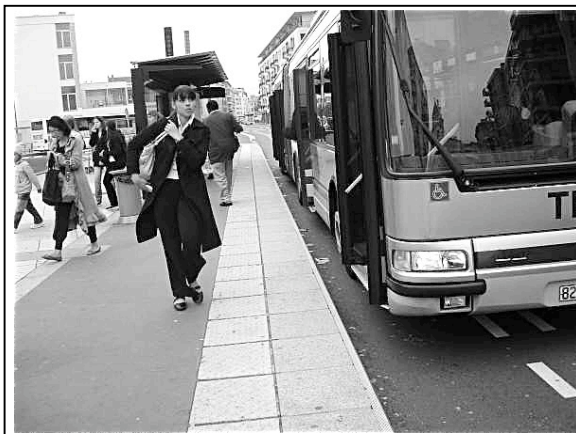
Photo 1 : Accostage en mode manuel d'un bus de la ligne TEOR à Rouen. Mai 2007.

Dès lors que le guidage optique est inactif alors il est de bon sens de revenir aux pratiques antérieures c'est-à-dire d'accoster à distance du quai afin d'éviter des accidents. Cette logique est partagée par les conduc-