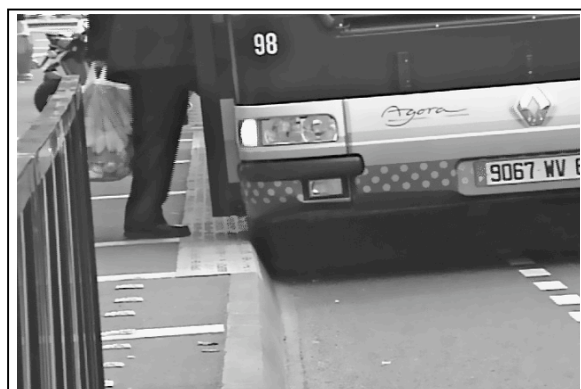
Photo 2 : Accostage en mode manuel d'un bus de la ligne « avec » guidage optique en panne à Clermont-Ferrand. Avril 2005.

À Clermont-Ferrand, à la différence de Las Vegas, les leçons de cette expérience ne sont tirées qu'au travers d'une expertise syndicale. La reconnaissance de la capacité des conducteurs à réactualiser la valeur d'un dispositif malgré la disparition du guidage optique, élément central de ce dispositif technique pour les concepteurs et décideurs, reste locale, enfermée dans l'organisation de l'exploitation du réseau. Cette innovation dans la technique d'accostage ne parvient même pas à être reconnue comme une ressource par l'autorité organisatrice du réseau de Clermont-Ferrand. Elle ne parvient pas plus à être prise en compte par les services de l'État en charge d'élaborer les bonnes pratiques et de les diffuser, le Certu (Centre d'Études sur les Réseaux, les Transports, l'Urbanisme).