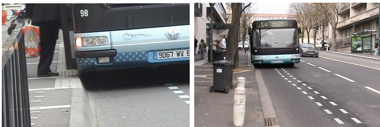
Photos 3 et 4 : accostages avec le dispositif de guidage optique inactif aux stations Carnot et Faculté

À Clermont-Ferrand ce ne sont pas les conditions climatiques qui furent à l'origine de la défaillance du guidage optique mais un manque probable d'engagement de la part des responsables de l'agglomération dans cette logique de modernisation. La conception du site, les problèmes de maintenance de la voirie et des problèmes récurrents de qualité de peinture furent à l'origine d'une dégradation rapide du fonctionnement du guidage optique. Les conducteurs firent face à cette situation en prenant appui, au sens physique du terme, sur la conception des bordures de trottoir. Plutôt que de s'en servir comme chasse roue, ils les utilisèrent comme guide roue. La conception des pneumatiques permettait cet usage sans que cela ne présente de risque. On voit sur les photos 3 et 4 que les bus sont plus proches du quai que s'ils avaient accosté en mode automatique (Foot, 2007).