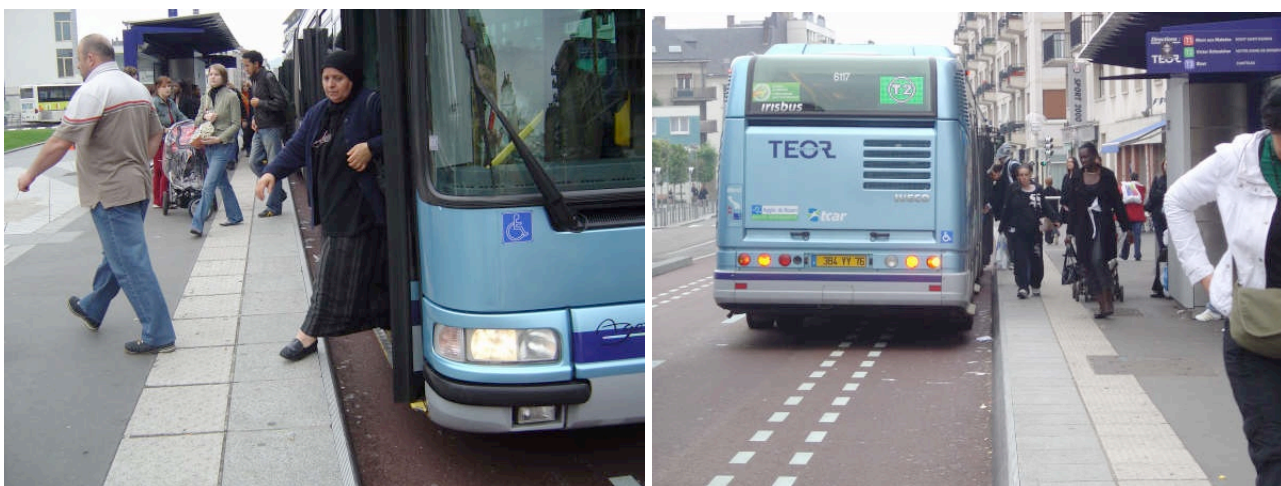
Photo 1 et 2, TEOR, mai 2007, pour des raisons de maintenance le guidage optique est maintenu inactif.

En 2007, une opération de maintenance conduit à suspendre provisoirement l'usage du guidage optique. Par prudence, puisque l'exploitation des lignes a confirmé le bien fondé des hypothèses initiales et des prescriptions données pour la conduite automatique, consigne est donnée aux conducteurs d'accoster à distance du quai afin d'éviter tout incident. Cette consigne ne soulève pas de question puisqu'il a été démontré par l'expérience qu'avec l'automate on réussit à réaliser avec régularité des accostages de bonne qualité ce que l'on ne faisait pas avant avec la conduite manuelle. Il aurait été absurde de demander aux conducteurs de réaliser, pour une courte période, une prouesse qui, précisément, a justifié l'investissement dans ce dispositif. Dès lors que celui-ci est inactif alors il est de bon sens de revenir aux pratiques antérieures c'est-à-dire d'accoster à distance du quai afin d'éviter des accidents.