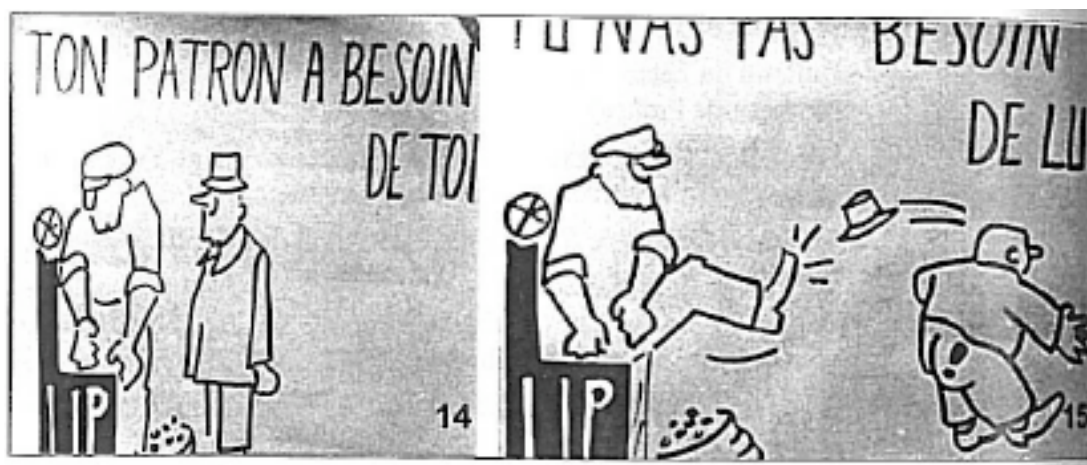
Annexe 1 : Affiche anti-patronale des ouvriers Lip