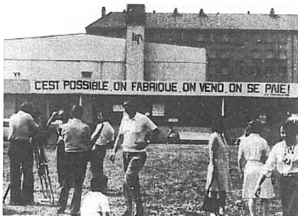
«L'usine Lip-Jean-Zay».