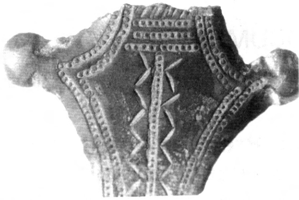
Fig. 2 - Détail du décor sur l'agrafe de Florensac.

3). Les agrafes de ce type se rencontrent essentiellement, de part et d'autre des Pyrénées, au Nord-Est de l'Espagne et en Languedoc. Elles sont rares en dehors de ces régions, ne se trouvant que très sporadiquement au-delà de l'Ebre et sur la façade atlantique. Une agrafe de ce modèle a néanmoins été signalée en Forêt Noire, dans le tumulus du Magdalenenberg (4) (fig. 3).