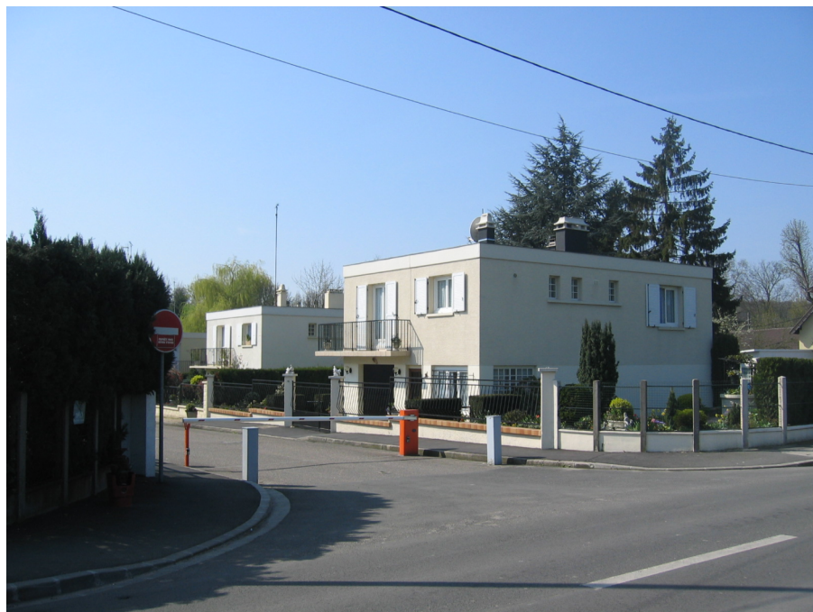
Figure 2 – Une voie privée fermée en Seine-Saint-Denis.