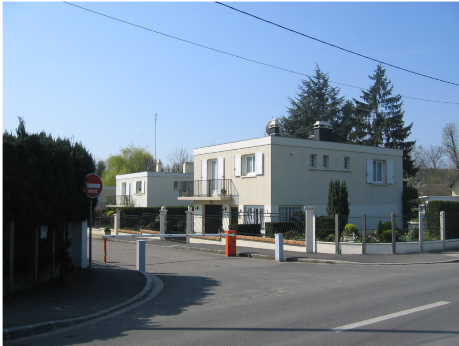
Figure 2 – Une voie privée fermée en Seine-Saint-Denis.