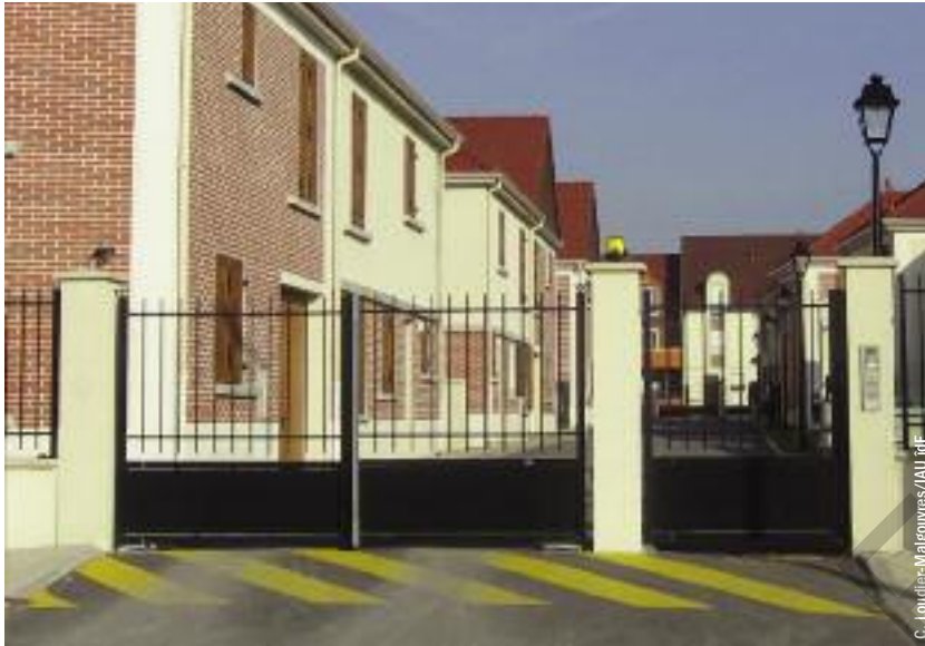
Ensemble individuel fermé neuf à Corneilles-en-Parisis, Val d'Oise.

Renaud Le Goix (1) Université Paris 1 Panthéon-Sorbonne