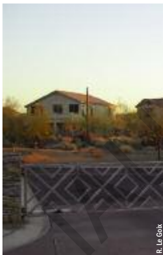
Entrée automatique d'une gated community près de Phoenix, Arizona.

À l'échelle locale, le développement des gated communities est, d'une part, une forme d'urbanisation soutenue par les collectivités locales, destinée à faire porter le coût de l'étalement urbain sur le secteur privé (promoteurs, et in fine , acquéreurs du logement), et d'autre part, un moyen efficace de protéger à long terme l'investissement immobilier. Les lotissements fermés, espaces enclos et privés, conduisent à un report des coûts d'aménagement et d'entretien collectifs sur une entité privée, tout en assu-