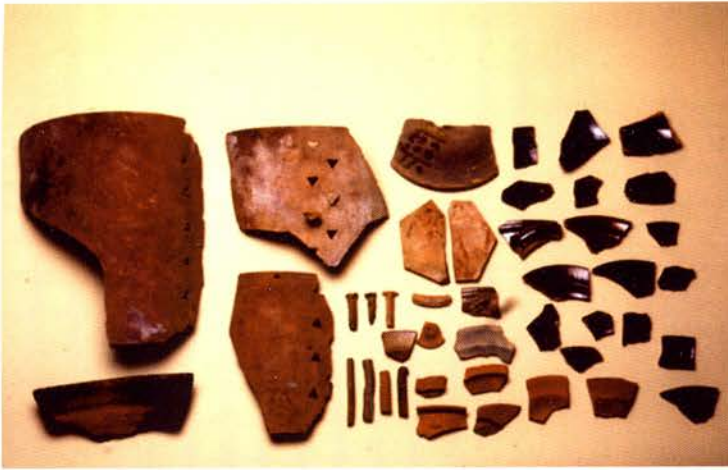
Collection Laboratoire d'Archéologie médiévale méditerranéenne Cazettes, clous, boudins biscuits et rebuts d'assiettes noires

duction sur laquelle nous renseigne l'enquête entreprise par le préfet Chabrol de Volvic, dans le département du Monténotte entre 1805 et 1812 (département français à cette époque).