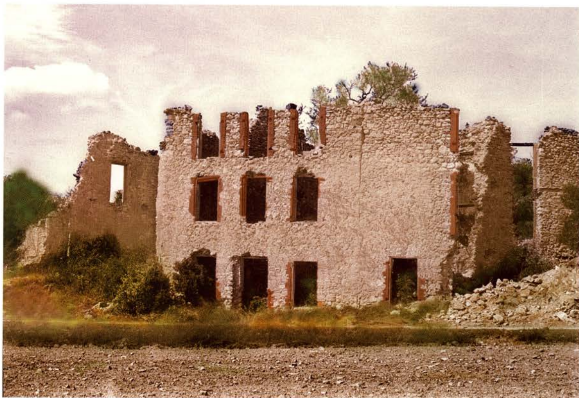
Ruines de la fabrique

À 400 mètres d'altitude, sur le plateau de Bèdes qui domine la Durance au carrefour du défilé de Mirabeau, d'imposantes ruines d'un bâtiment industriel émergent dans un paysage resté encore aujourd'hui à vocation agricole et pastorale. Cette fabrique isolée, à l'écart du hameau de Bèdes et à 5 km du village de Jouques est sise au lieu-dit Villemus, sur le chemin qui mène à la Grande Séouve et au pied de la Montagne de la Vautubière. Son implantation est sans doute liée à la présence de bancs d'argiles rouges proches, propices à l'artisanat de la terre comme l'indique le toponyme voisin de la Touline (aujourd'hui Tanlire) 1 déjà répertorié sur la carte de Cassini au XVIII e siècle. L'eau était amenée par des canalisations à partir du captage d'une source située dans le vallon tout proche au nord. Une grande citerne permettait en outre le stockage des eaux de pluie dans l'entresol de la maison principale. Les bâti-