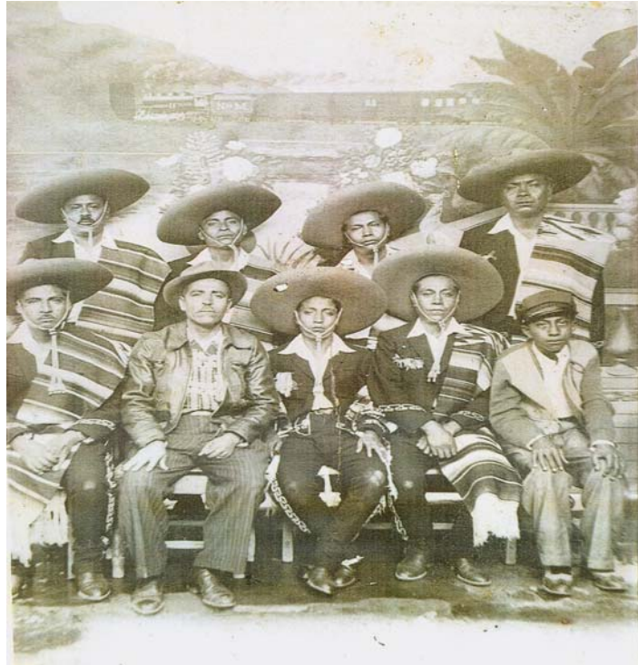
1er mariachi de Mayorazgo Secc. 10.