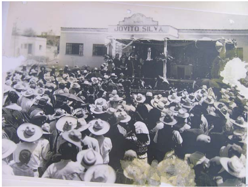
Jardín de niños «Jovito Silva»