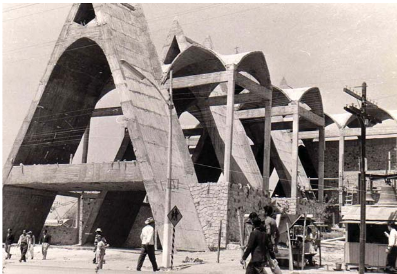
Construcción del Templo de San José Obrero