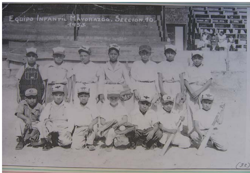
Equipo infantil de Mayorazgo, 1953.