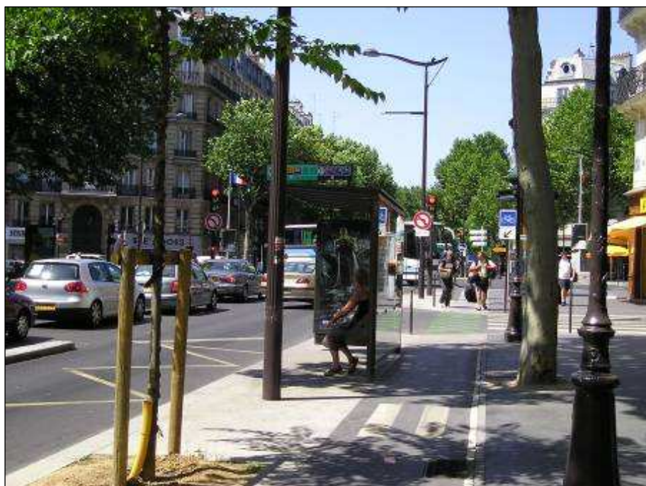
Figure n°2. Le boulevard Magenta réaménagé en « espace civilisé » (☑ Antoine Fleury, 16/07/2007)

2005) et des principes d'aménagement en conséquence plus pragmatiques 15 expliquent en partie cette différence. Il est également vrai que, dans une ville aux densités moindres qu'à Paris, la voirie est suffisamment large pour accueillir tous les usagers sans conflits majeurs.