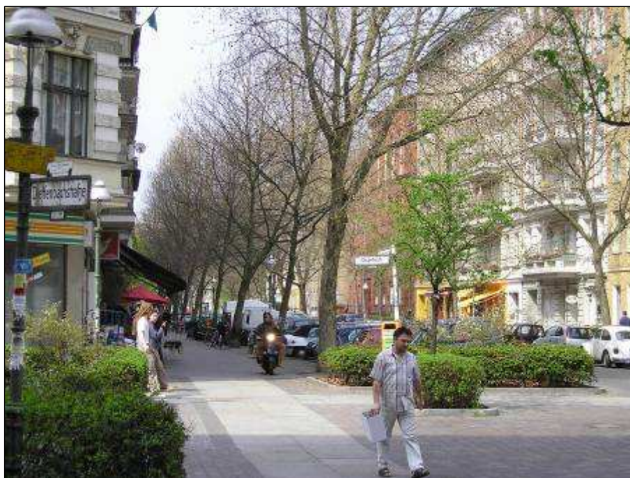
Figure n°1. Une « verkehrsberuhigte Zone » à Berlin-Kreuzberg