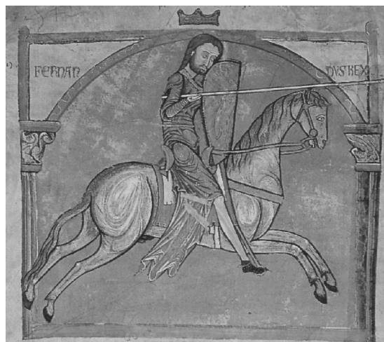
Ferdinand II de León Tumbo A Cathédrale de Santiago

Dès la découverte du tombeau vers 820-830, les rois avaient célébré le saint comme "patron et seigneur de toute l'Espagne" (en 834), "notre patron et de toute l'Espagne" (en 858), et enfin "notre très valeureux patron" (en 952) 18 . Or le roi, au milieu du XI e siècle, est avant tout celui qui conduit les armées à la victoire: la véritable "restauration" de l'Espagne chrétienne – le mot "reconquête" est une invention de la fin du XVIII e siècle – a effectivement commencée. Au XII e siè-