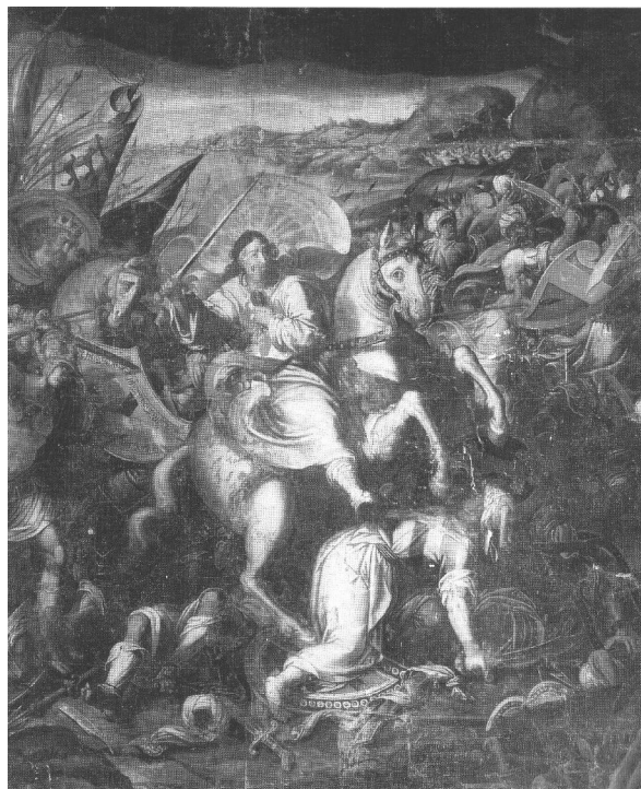
Mateo Pérez de Alesio La bataille de Clavijo (1587) Séville, Église Saint-Jacques

milieu du XII e siècle? L'histoire du privilège des voeux à la suite de la bataille de Clavijo a déjà donné lieu, entre le XVI e et le XVIII e siècle, à une ardente polémique qui en a transformé le sens 3 . Or, au contraire de l'histoire de Charlemagne découvrant le