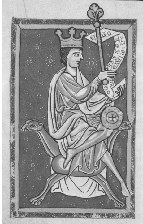
Ramire II de León Liber Testamentorum Cathédrale de León

vilège concédé à l'église de Compostelle en février 934 révèle en outre que le roi et la reine s'étaient rendus cette année-là