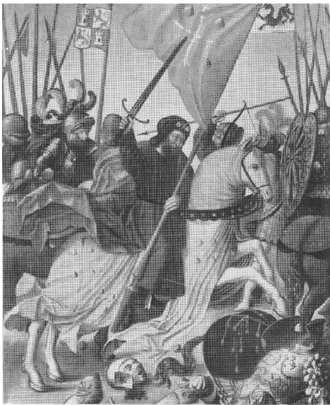
Santiago. XV e siècle Madrid. Musée Lázaro Galdiano

C'est au XV e siècle que commencent, timidement encore, à apparaître des images de l'Apôtre, parfois encore vêtu en pèlerin, monté sur un cheval blanc qui foule au pied des têtes coupées de musulmans. Cette nouvelle représentation coïncide d'ailleurs avec une image royale: dans les Généalogies des rois de Castille d'Alfonso de Cartagena, le roi Henri IV (1454-1474) est représenté à cheval, portant une grenade