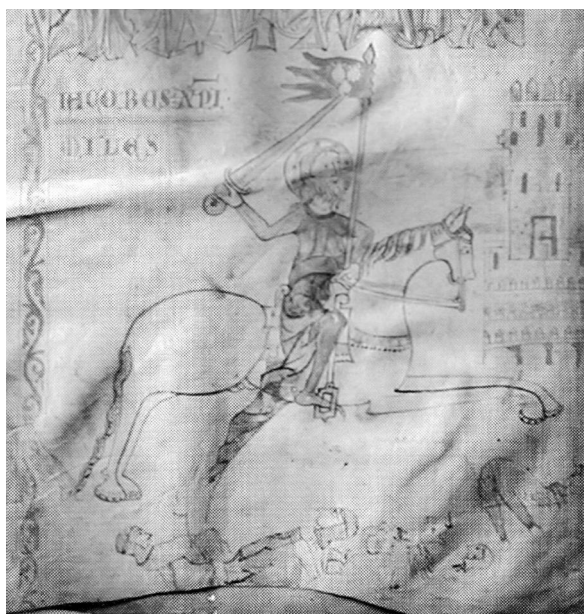
Tumbo B , f° 2v Cathédrale de Santiago

du roman, ceux de la Table Ronde. Saint Jacques est le protecteur des rois et des chrétiens d'Espagne contre tous leurs ennemis, comme saint Denis l'est des Français. Il n'est pas systématiquement associé à la lutte contre le musulman, il n'est donc pas encore le "matamore": aux pieds de sa monture, ce sont les jeunes filles du tribut honteux racheté à